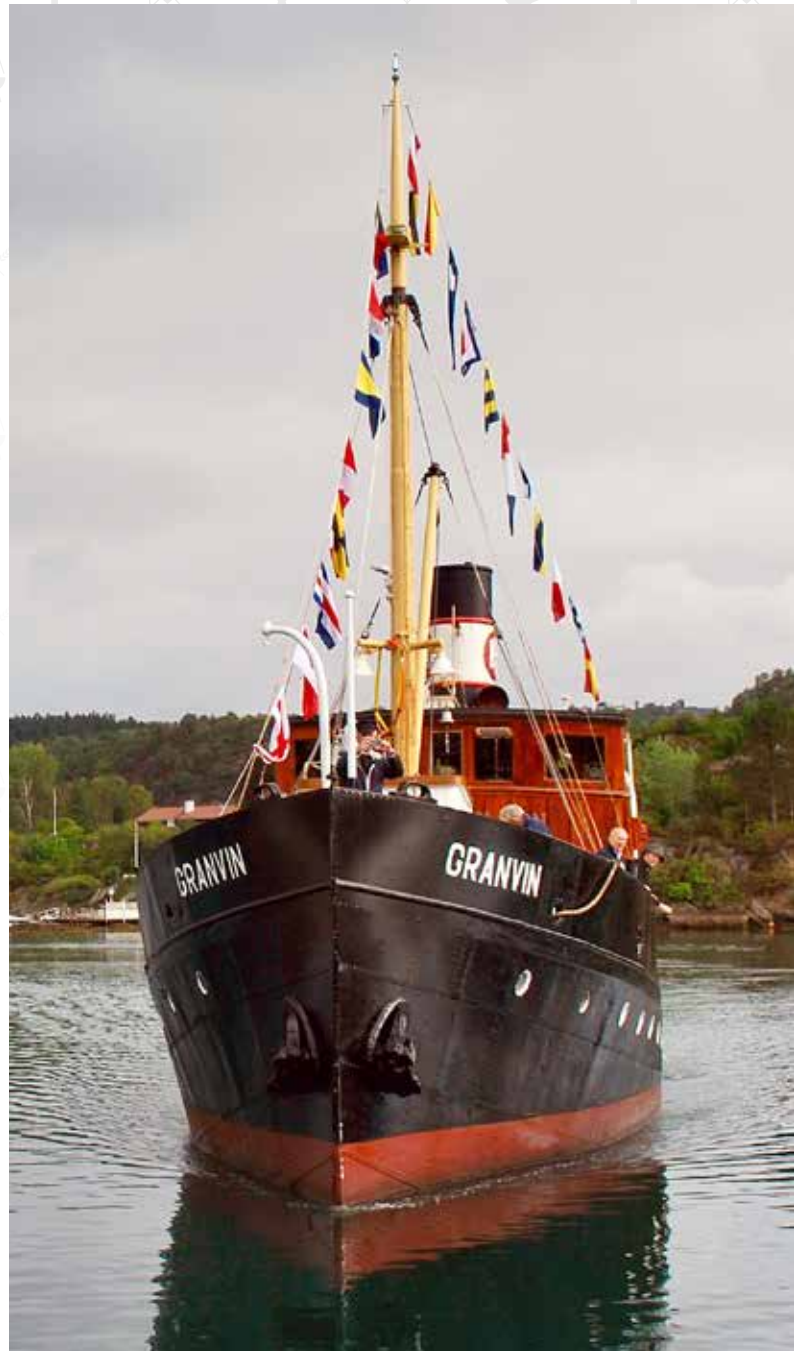
KIRKEFERD I VETERANBÅT: MS Granvin var en av de tre veteranbåtene som tok folk med på kirkeferd 5. august. Den eies nå av Veteranskipslaget Fjordabåten, og ble fredet av riksantikvaren i 2011.

Jeg går en tur i messen forut, og sitter på en av de brune stolene som tross polert velholdhet ser ut som om den har