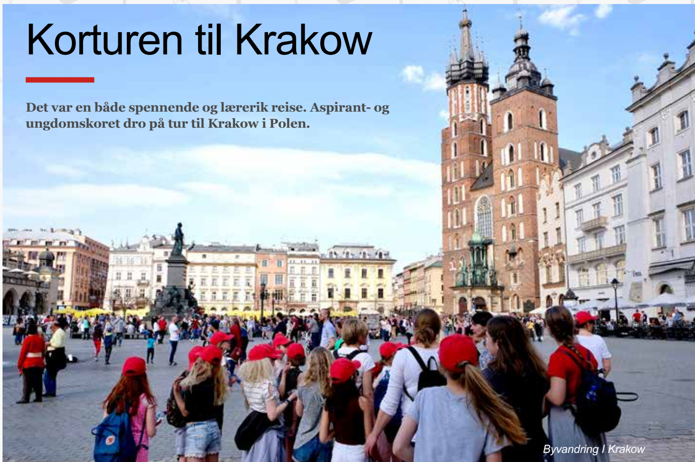
Byvandring i Krakow

Det var en både spennende og lærerik reise. Aspirant- og ungdomskoret dro på tur til Krakow i Polen.