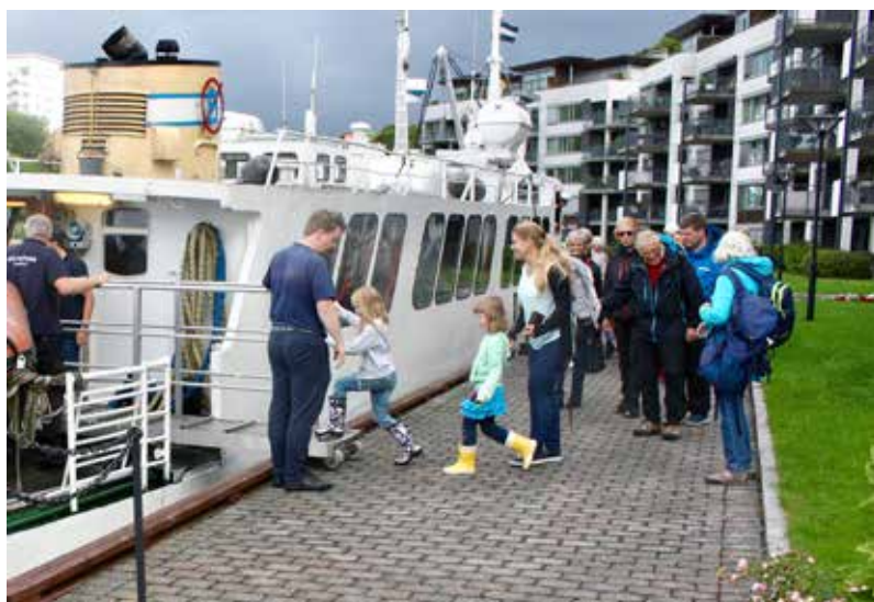
MELLOMSTOPP: Veteranbåten MS Vestgar tar opp passasjerer i Breiviken.