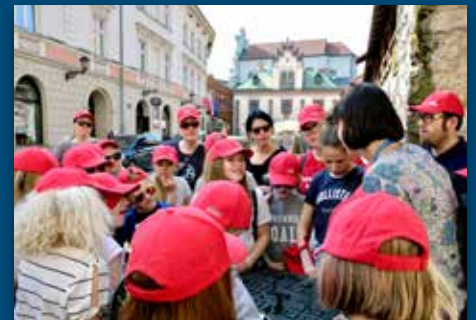
Kortur til Krakow Side 19