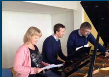
Konsert med nordisk trio Side 17