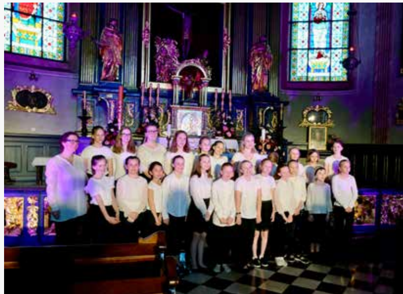
Konsert i St. Barbara-kirken

Dette var en fantastisk tur vi alle vil huske! Vi er veldig glad og takknemlig for at vi fikk denne muligheten, og håper vi kan få være med på en ny minneverdig reise!