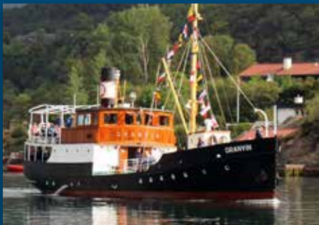
Kirkeferd i veteranbåt Side 5-7