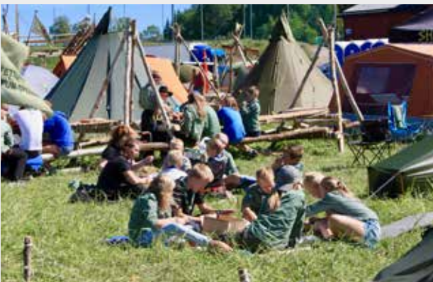
FRILUFTSLIV OG FELLESSKAP: Det trengs flere speiderledere, vil du være med i speiderfelleskapet?

Foreldre og andre kan her være med på å gi barna trygghet og nyttige kunnskaper. Og som speiderleder får man mange gode og rike opplevelser. Det trengs flere speiderledere, vil du være med i speiderfelleskapet?