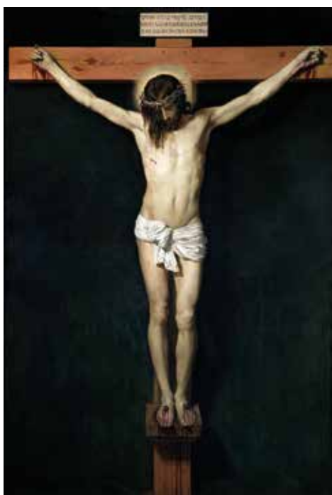
DØDE FOR AT VI SKULLE GÅ FRI: Jesus døde og sonet for alle menneskers overtredelser i fortid, nåtid og framtid. (Illustrasjon: Korsfestelsen av Jesus, oljemaleri fra 1632 av Diego Velázquez).

Jødiske kulturen der Jesus hadde sitt virkefelt, hadde en klar overbevisning om sin oppgave, han visste hva han skulle og hvorfor.