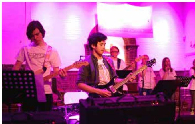
EGET PROSTIBAND: Prostibandet ledet oss i lovsangen.