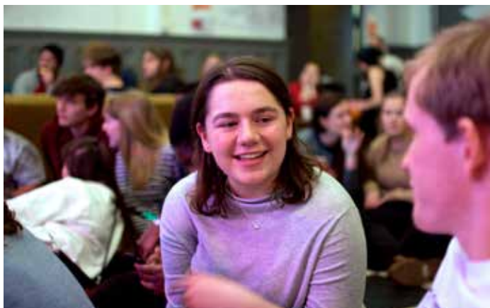
MAT OG PRAT: Kveldene starter alltid med en del vi kaller Friday Friends & Food. Det betyr fredagsmat, lek, prat og kahoot.