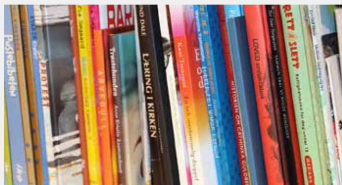
KRISTEN LITTERATUR I BUTIKKHYLLENE: Bergenserne er glade for at det igjen er en kristen bokhandel i sentrum, etter at den åpnet i oktober 2015.

Per første kvartal i år er omsetningen økt med om lag ti prosent siden i fjor, og hver uke er det folk som besøker bokhandelen på Øvre Korskirkeallmenningen for første gang, til tross for gravearbeider som er planlagt å vare i enda halvannet år i området. Slik er det å være nisjebutikk. Bergen Kristne Bokhandel har det brede utvalget av kristne bøker for alle aldersgrupper og anledninger.