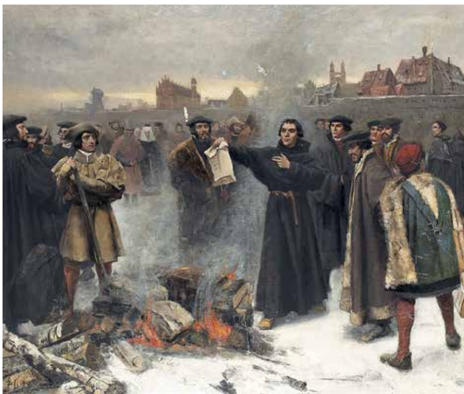
STOD OPP MOT PAVEMAKTA: Den 15. juni 1520 kom pavebullen Exurge Domine frå pave Leo X, der han fordømte 41 læresetningar frå Martin Luthers skrifter. 10. desember same år brennde Luther demonstrativt bullen framom Elsterporten i Wittenberg. (Illustrasjon: Oljemåleri av Karl Aspelin, 1885)

Professorar frå fleire fagfelt freista å svare. Som interessert tilhøyrar sat eg igjen med at svaret på spørsmålet var JA. Arven etter Martin Luther, som vi har i den evangelisk-lutherske kyrkja, har medverka sterkt til det velferds-samfunnet og demokratiet vi har i dag. Her ligg vi langt framom katolske land og land som er dominerte av andre religionar.