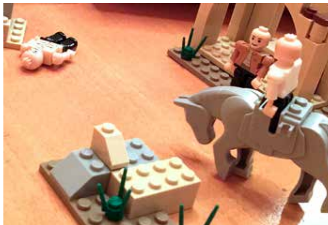
BYGG DIN EGEN JESUS-LIGNELSE: Byggesettet med den barmhjertige samaritan som tema er nå en del av trosopplæringen «TilTro» i Åsane menighet.