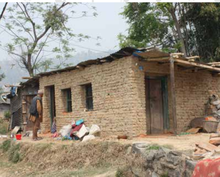
MISTA ALT I JORDSKJELVET: Kjøkkenhuset som er blitt reist for nokre av pengane som blei samla inn til guidens familie.