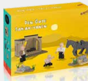
LEK OG LÆR: Byggesettet inneholder brikker, figurer og et hefte som har både bibelteksten, en samtalestarter og byggeinstruksjoner.