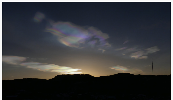
Perlemorskyene var ett vakkert syn i vinter, her sees de over Fanasåta.