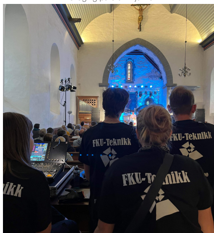
FKU kører lyd og lys i Fana kyrkje