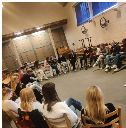
Ten Sing har øving