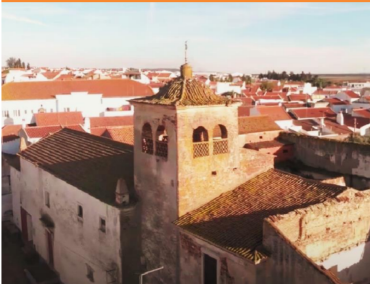
Kirken i Torrão