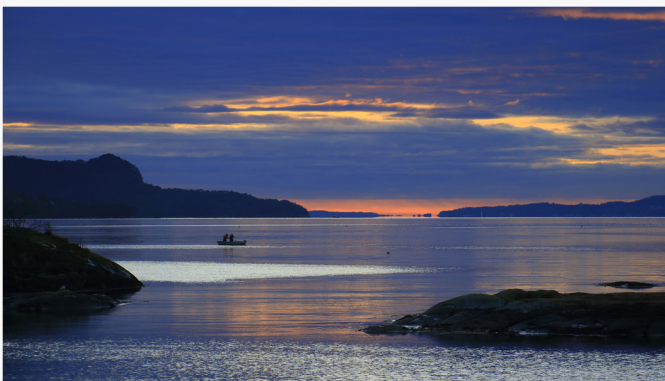
Nydelig lys over Fanafjorden. To fiskere setter garn mens de nyter stunden