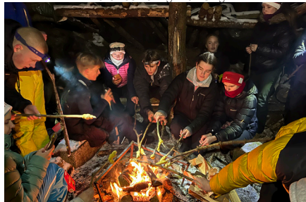
Lussekatte på bål