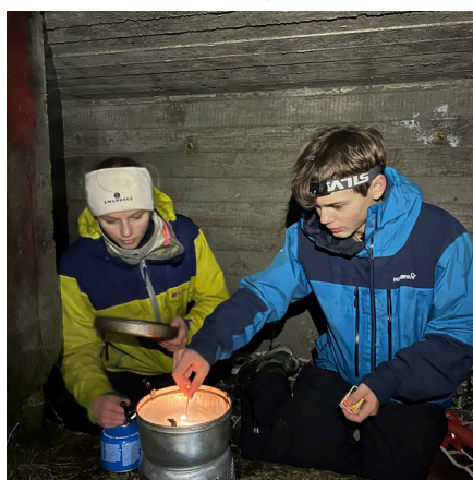
Matlaging på stormkjøkken