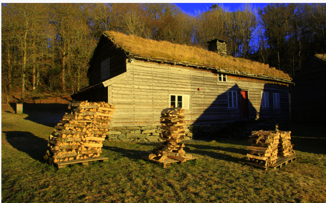
Fjellskålhuset på Hordamuseet i en lav vintersol, vedstabelene som kunstverk gir en fin idyllisk stemning.