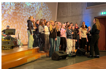
Ytrebygda ten sing 30 år