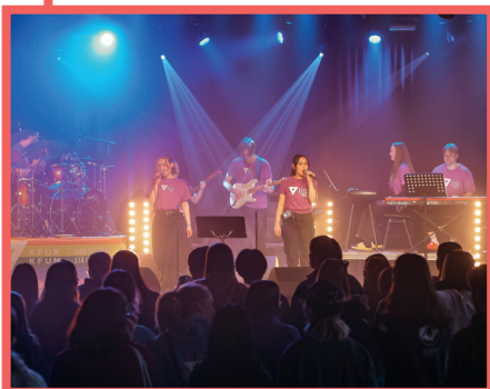
God stemning under åpningsshowet på Vinterfestivalen 2024!