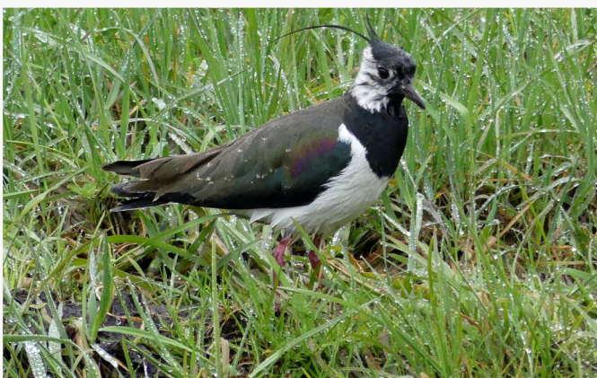
Viben er tidlig å se om våren og den skaper virkelig vårføle en nydelig fugl, vi må verne godt