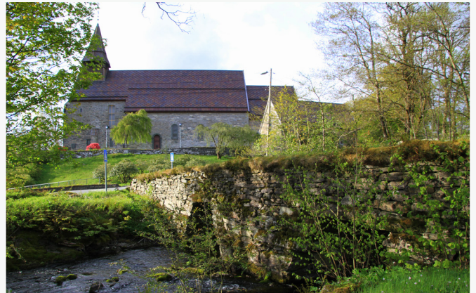
Fanakirken og litt av Fana-bygden rundt Stendavannet sett fra Fanakirken, Fanaelven og den ca 250 år gamle steinbroen, skaper nostalgiske tilbakeblikk i Fana-bygden.