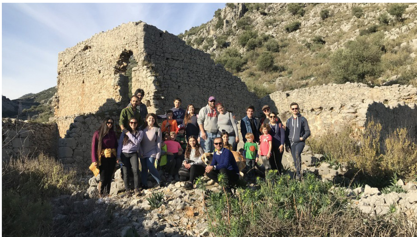
Menigheten i Antalya på tur.