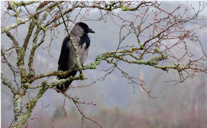
En av våre viktigste og mest intelligente fugler, nydelig er den, her overvåker den området.

Atle Skjerlie har funnet frem flere blinkskudd for God Helg-leserne! Du finner flere flotte Fana-bilder på facebook-siden "Fotogutt Atle" og på YouTube-kanalen "Atle, fotogutt. skjerlie"