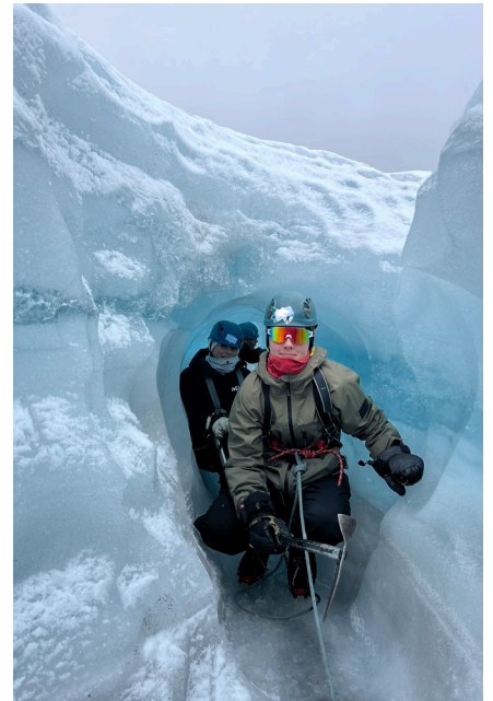
SkogOgSånn på brevandring