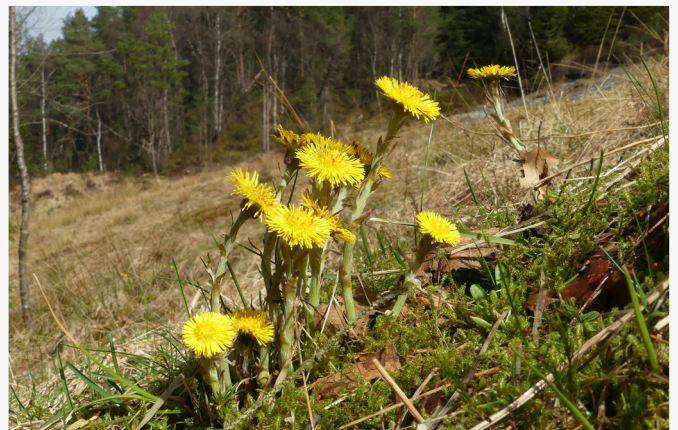
Hestehoven som første blomst lyser smølgult i en tidlig vårdag.