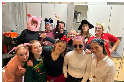
Halloweenfeiring i Ten Sing