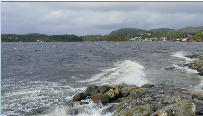
Sterk vind fra vest inn Fanafjorden skaper urolig sjø.