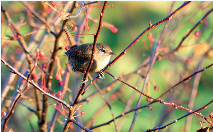
Gjerdesmetten er en av de minste fuglene i Norge. Her ser vi en som koser seg i kveldssolen