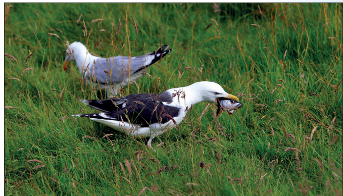
Svartbaken er en ekte "slukmåse"