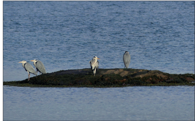
Gråhegren tar en rolig aften på skjæret