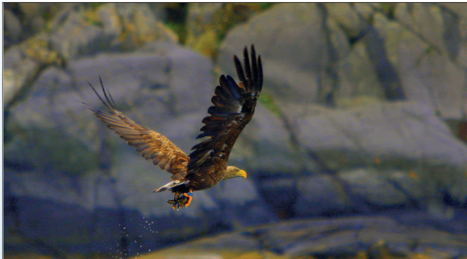
Havørnen er en majestetisk fugl; her kommer den ned og tar fisken jeg har kastet ut. Her fra ytterst i Austevoll.