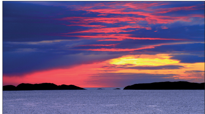
Solnedgangene helt vest i havgapet var helt magisk nå slutten av oktober