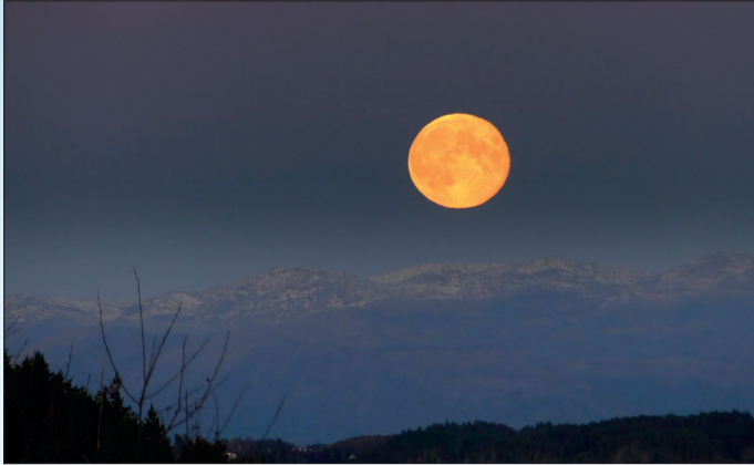
En lav fullmåne skaper en nydelig stemning over fjellene i øst, sett fra havgapet i Austevoll.