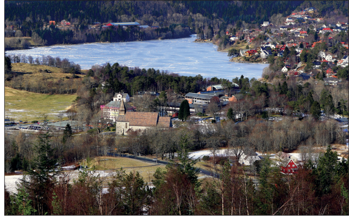
Fanakirken og litt av Fanabygden rundt Stendavannet sett fra Ramberget