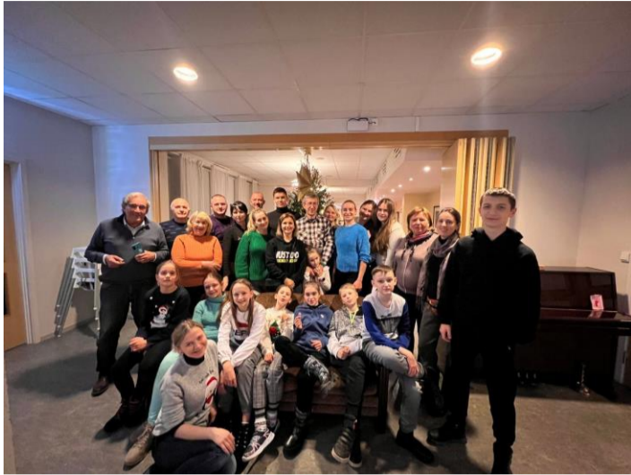
Noen av deltakere på juleaktivitetene

I siste uke av advent hadde vi Juleaktiviteter. Vi hadde bakedag hvor vi bakte tradisjonelle norske julekaker og pepperkakehus, juleverksted der vi laget pynt – som ble både brukt til å pynte rommet og for at deltakerne kunne ta med seg hjem, og julepyntesamling på lillejulaften. Hele denne uken hadde som mål å bygge samhold før felles julefeiring 24. desember. På julekvelden var det 42 deltakere på feiringen vår, ca. to tredjedeler fra Ukraina. I løpet av en uke av juleaktiviteter deltok 76 personer.