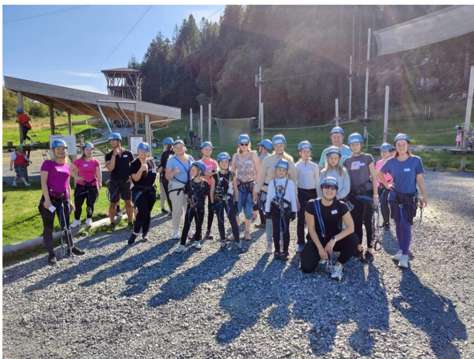
Høyt og Lavt-turen

I september hadde vi i tillegg tur til klatreparken “Høyt og lavt” som familietilbud for deltakere på Internasjonal middag. Vi hadde 30 deltakere, derav 18 barn. Ca. halvparten var fra Ukraina. Vi ble kjent med hverandre og hadde tre aktive timer sammen i parken.