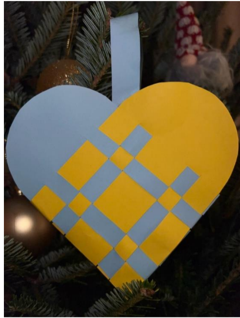
Flettehjerte laget av et av de ukrainske barna på juleverkstedet

I 2022 hadde vi mye fokus på de ukrainske familiene som hadde flyktet fra hjemlandet på grunn av krigen, samtidig som vi videreførte arbeidet for våre faste deltakere. Vi fortsatte med Kafé Dele annenhver uke og Internasjonal middag én gang i måneden. Vi tilbød også en rekke ulike sommeraktiviteter. Vi fikk innvilget søknad om tilskudd på femti tusen kroner til aktiviteter for ukrainske flyktninger fra Kirkerådet. Derfor hadde vi mulighet å tilby tur til klatreparken Høyt og Lavt for 30 personer, og ulike juleaktiviteter.