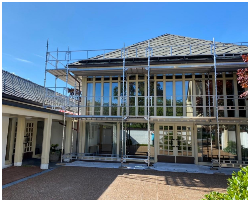
Innpakket kirke også høsten 2022

Vi strever med oppvarmingen av kirken i vinterhalvåret – særlig når vi må spare strøm.