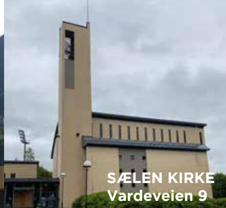
SÆLEN KIRKE Vardeveien 9