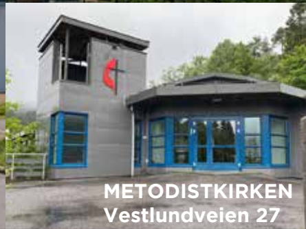
METODISTKIRKEN Vestlundveien 27