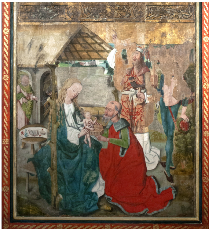
Utsnitt av alterskapet i Mariakirken i Bergen.