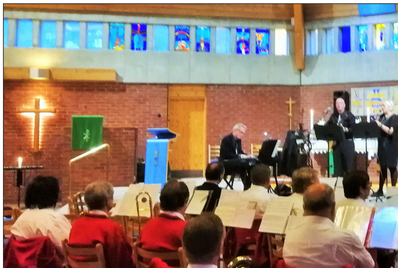
Minnemarkering for 4.oktober 1944 i Nygård kirke.