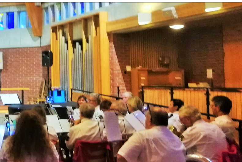
Musikkgruppen Triade og Nybø Brass