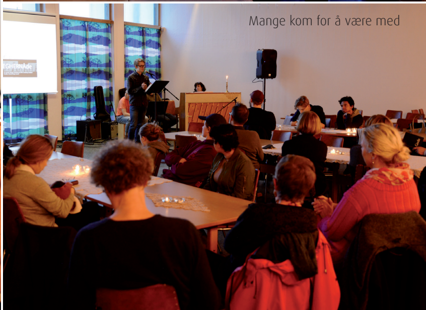
Mange kom for å være med