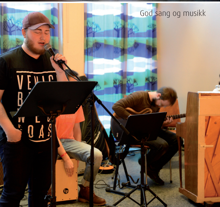
God sang og musikk