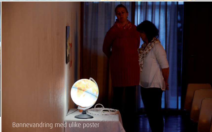
Bønnevandring med ulike poster