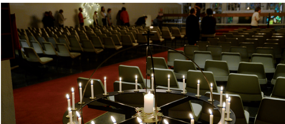
▲ Bønnevandringen er alltid spennende