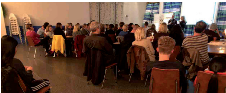
▲ Mange kom og det var god stemning i menighetssalen