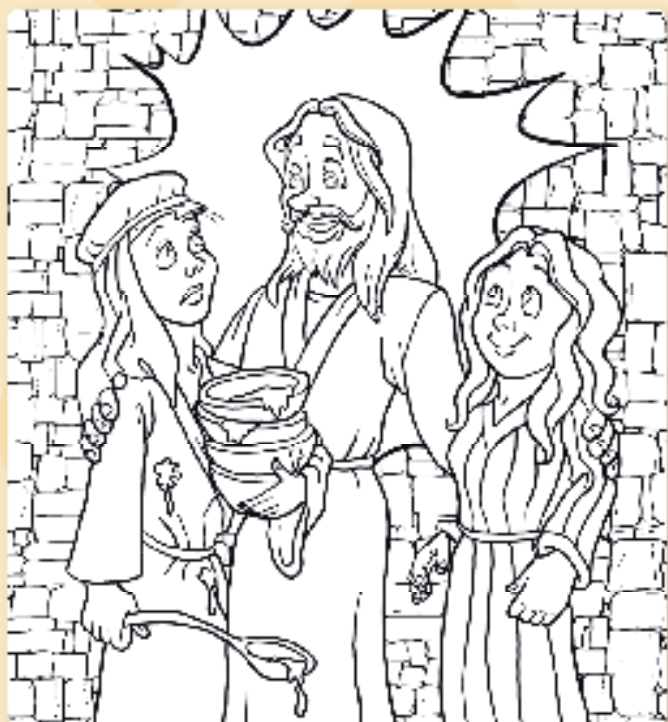
Tegning: Trevor Keen

Fargelegg! Jesus besøkte søstrene Marta og Maria. Marta stresset og kavet, mens Maria satte seg ned og lyttet til Jesus. Jesus sa: «Maria har valgt den gode del.»