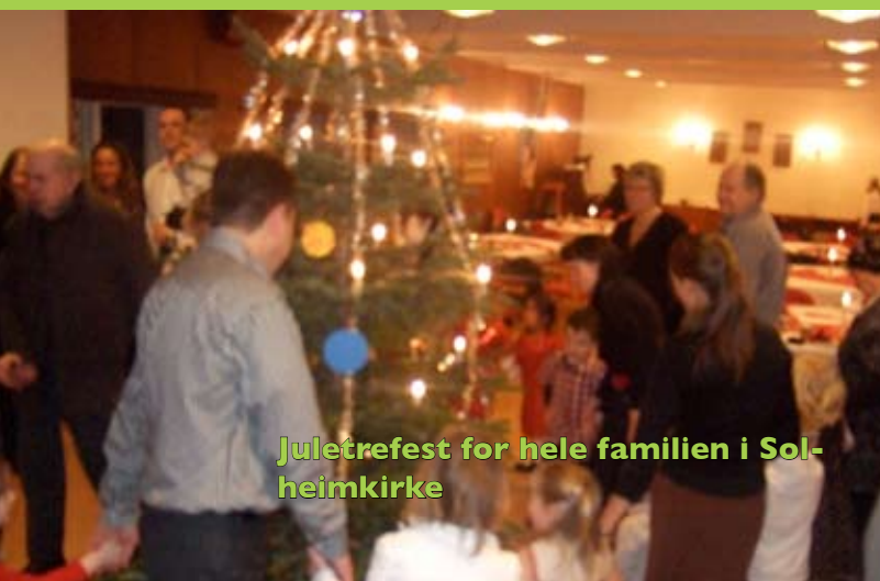
Juletreffest for hele familien i Solheimkirke