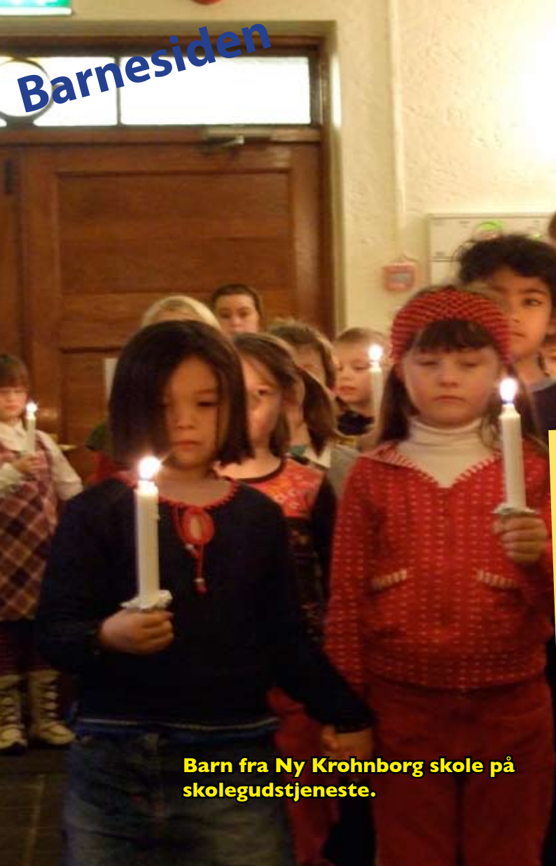
Barn fra Ny Krohnborg skole på skolegudstjeneste.