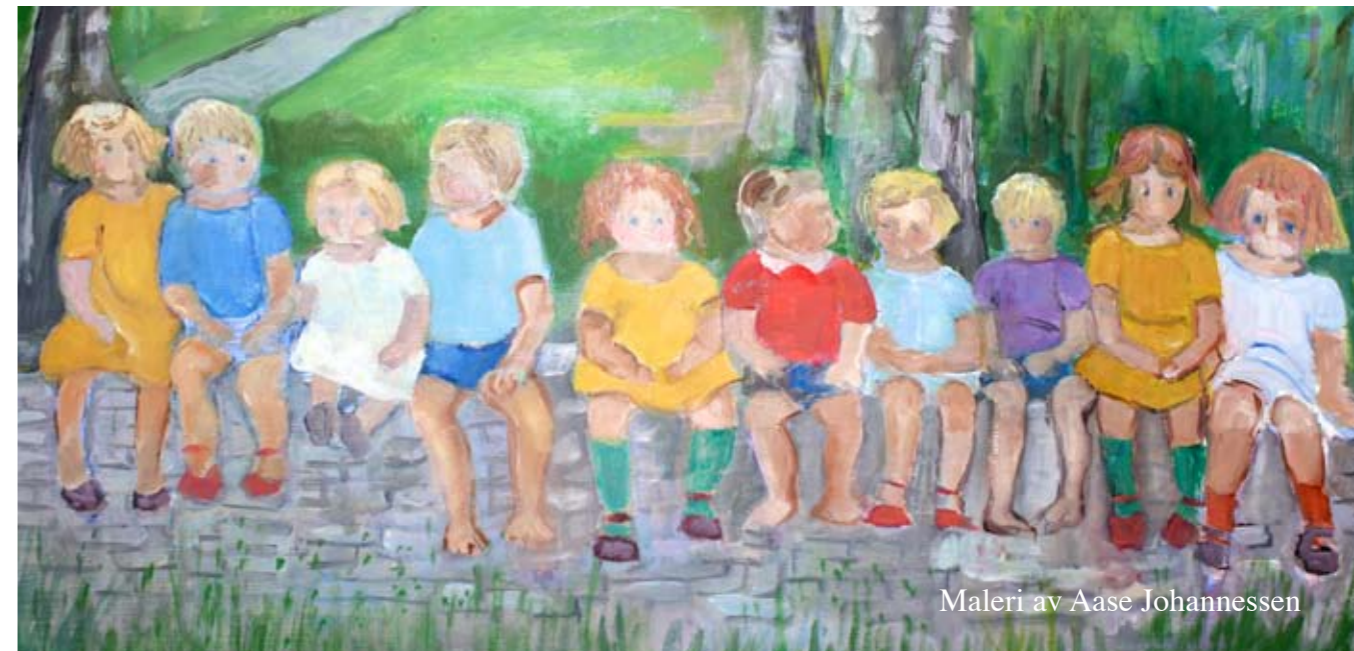
Maleri av Aase Johannessen