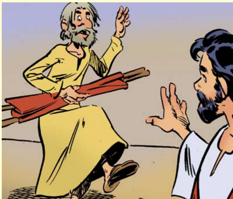
Bildetekst: En glad mann som tar sengen sin og går!