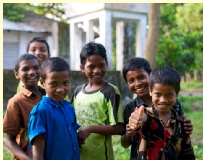
Søndagsskolegutter fra Bangladesh