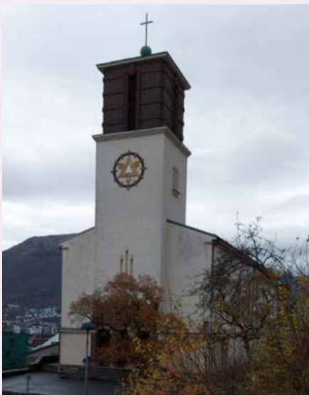
St. Markus kirke – Lien 45