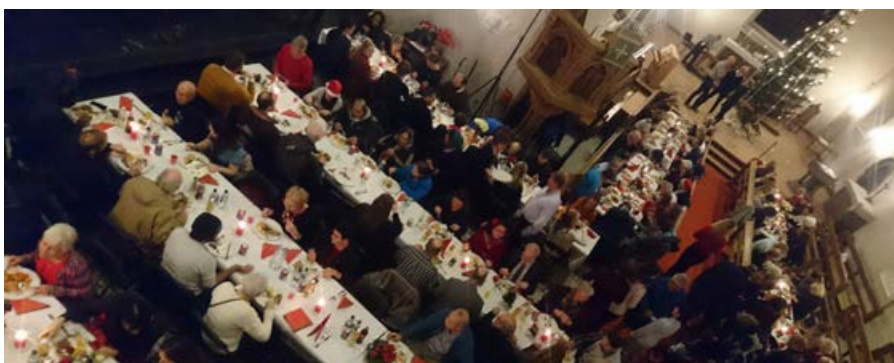
Fra den tradisjonelle julefeiringen i Korskirken. I år blir feiringen desentralisert til flere andre kirker, blant dem Solheim.

Hos oss begynner arrangementet julaften klokken 18. Det blir en tradisjonell feiring på alle måter, med servering av pinnekjøtt med poteter og kålrabistappe til middag, men med et vegetaralternativ for den som ønsker det. Og så blir det riskrem, julekaker og kaffe til dessert. Vi synger julesanger og leser juleevangeliet. Sannsynligvis blir