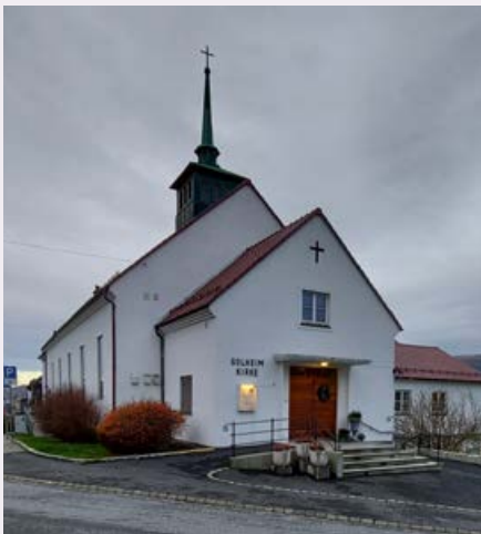
Solheim kirke – Hordagaten 28