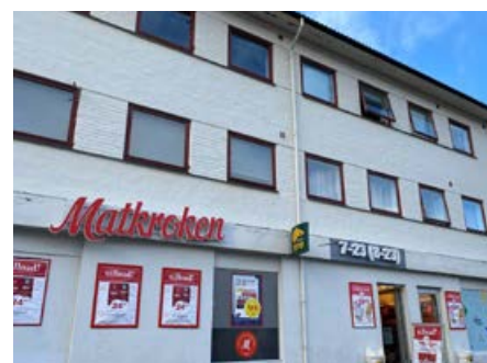
Her har noen kunder handlet i 50 år.

–Men det nytter ikke å vente med å kjøpe pinnekjøtt til juleaften, selv om vi er åpen til klokken 14, sier Marie: