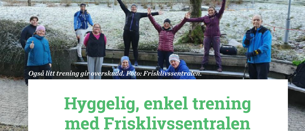
Også litt trening gir overskudd.