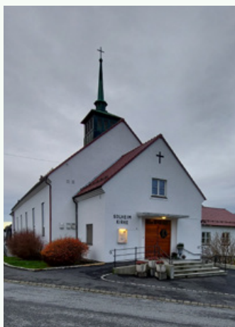
Solheim kirke – Hordagaten 28