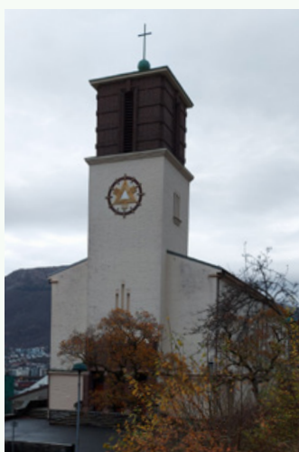
St. Markus kirke – Lien 45