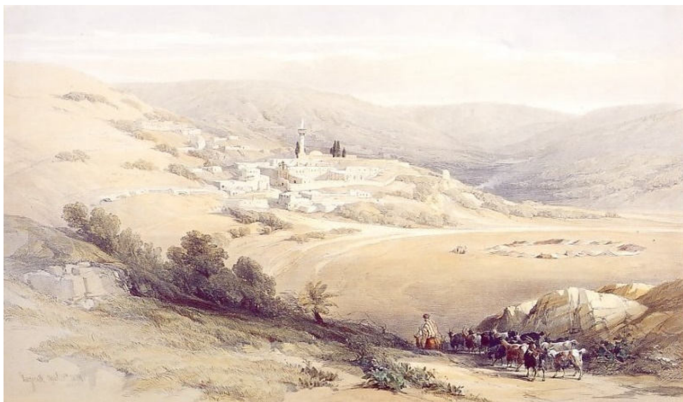
Nasaret som byen var ca. 1840. Steintrykk etter David Roberts.