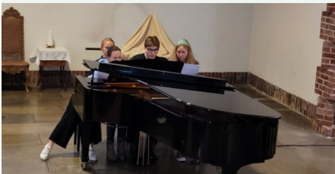
Bilde: fra Afternoon tea concert 23. oktober. Utøvere fra Grieg-akademiet (UiB) spiller 8-hendig klaver!

Afternoon TEA concert-serien og andre konsserter er under planlegging og fortsetter også i det nye året. Følg med på menighetens nett- og FB-sider.