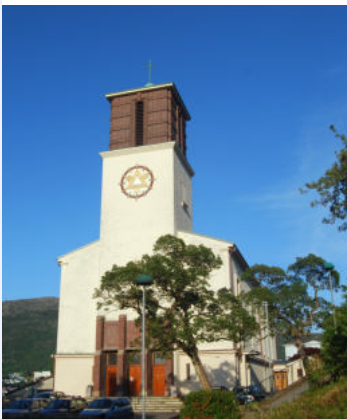
St Markus kirke Lien 45