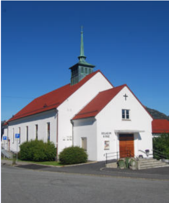
Solheim kirke Hordagaten 28