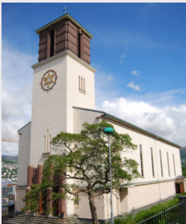
St Markus kirke Lien 45