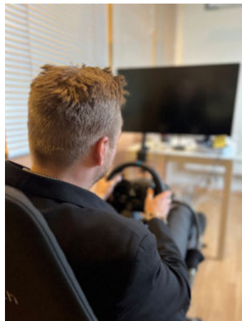
Gaming er gøy!

På et tidspunkt har vi tidebønn rundt alteret i kirkerommet.