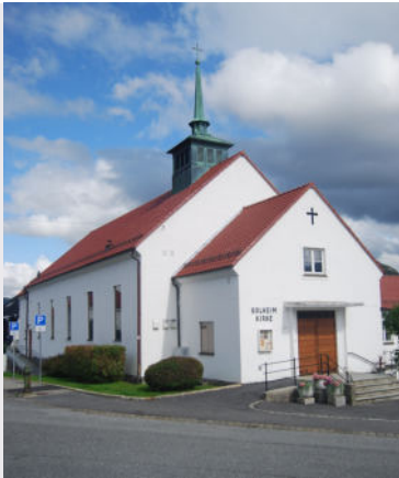
Solheim kirke Hordagaten 28