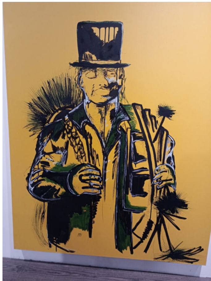
Drageland som feier, bilde laget av kunstneren Danielle Emilie Olsen

Kunne kirken samle ungdom og motvirke at man snakker ufint om andre religiøse samfunn? For alle har den samme skaperen som har laget