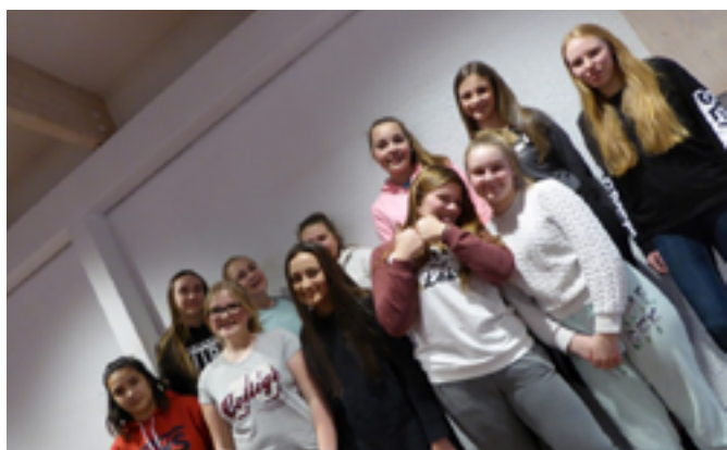
Konfirmantene i Olsvik TenSing