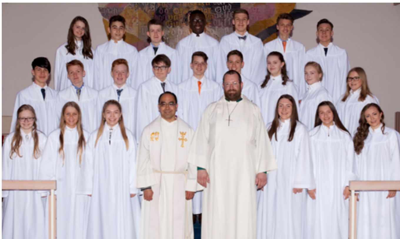
Olsvik menighetsblad 3-2016 7