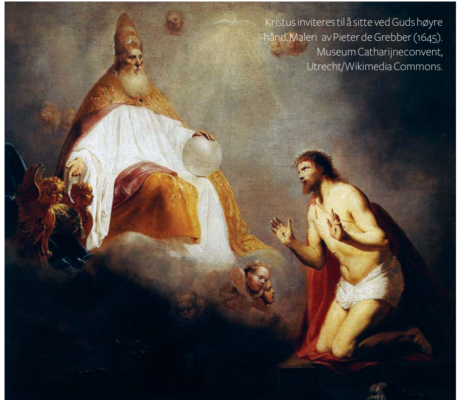
Kristus inviteres til å sitte ved Guds høyre hånd. Maleri av Pieter de Grebber (1645). Museum Catharijneconvent, Utrecht/Wikimedia Commons.

Nåde er det ord som blir utsagt først i en kristen gudstjeneste. Nådehilsen er hentet fra innledningen til nesten samtlige av Paulus ulike brev hvor han hilser