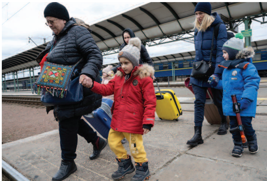
Ukrainere på flukt. Bildet ble tatt 11. mars.

Kirkens Nødhjelp rykket raskt inn sammen med sine partnere og bidrar med livsviktig hjelp til flyktninger, både i Ukraina, Ungarn, Romania og Polen. KN har et godt nettverk i området gjennom den internasjonale humanitære alliansen ACT Alliance. I tillegg arbeider den polske samarbeidspartneren Polish Humanitarian Action på tolv ulike steder i Ukraina og i grense-