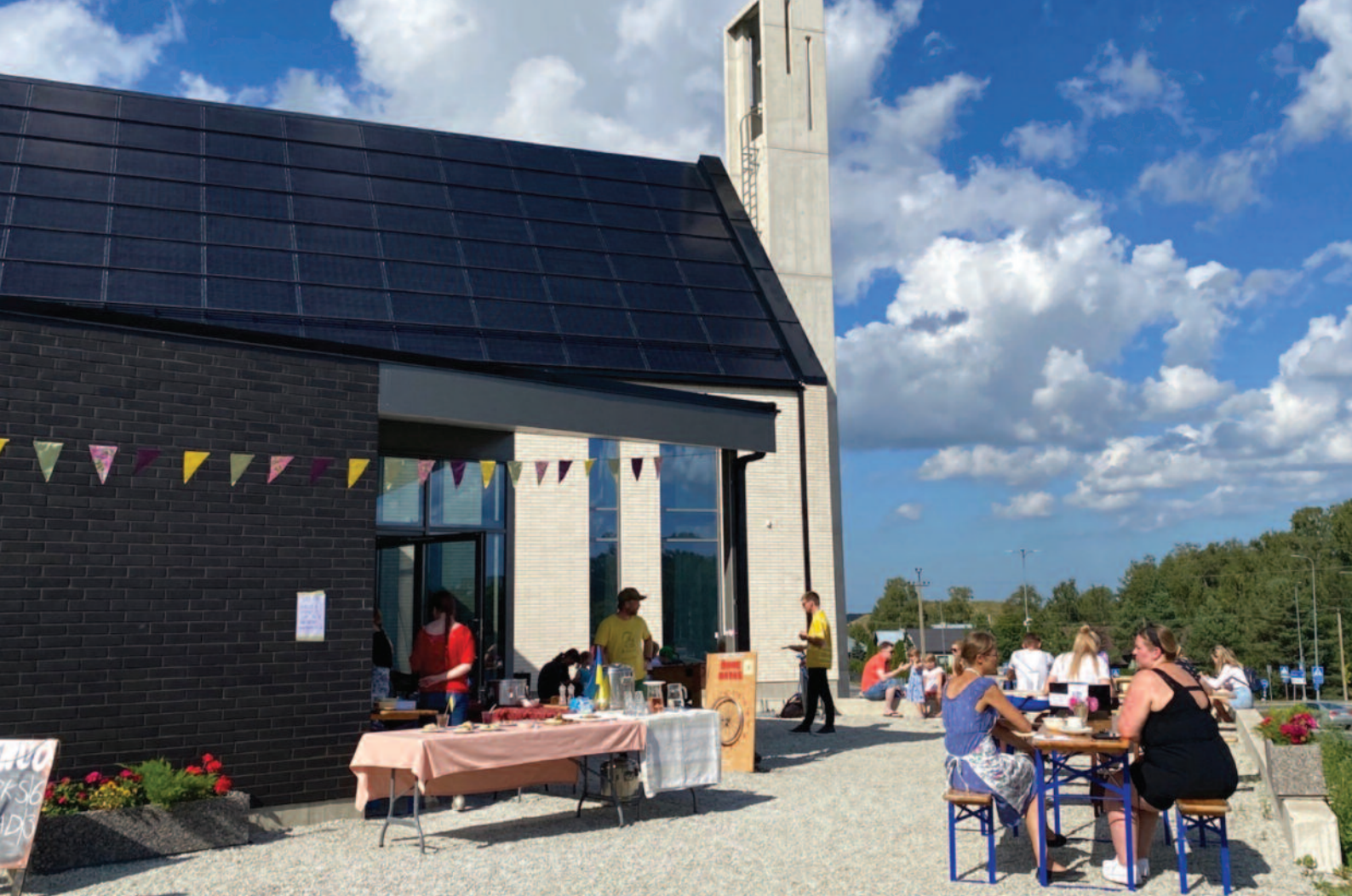
ESTLAND: St.Thomas-kirken i Saku, med solcellepaneler på taket!

Erkebiskopen talte og velsignet klokkene. Til jul kan man ringe julen inn i Saku for første gang i historien! Det har også kommet mange nye mennesker til kirka. Hver søndag siden september har det vært noen nye, og det har vært flere enn vanlig på gudstjenestene. I tillegg er det rekordstor konfirmantgruppe i høst. Det er 15 voksne mennesker som ønsker å lære om kristen tro, bli døpt (hvis de ikke er det fra før av) og konfirmert, og bli medlem-