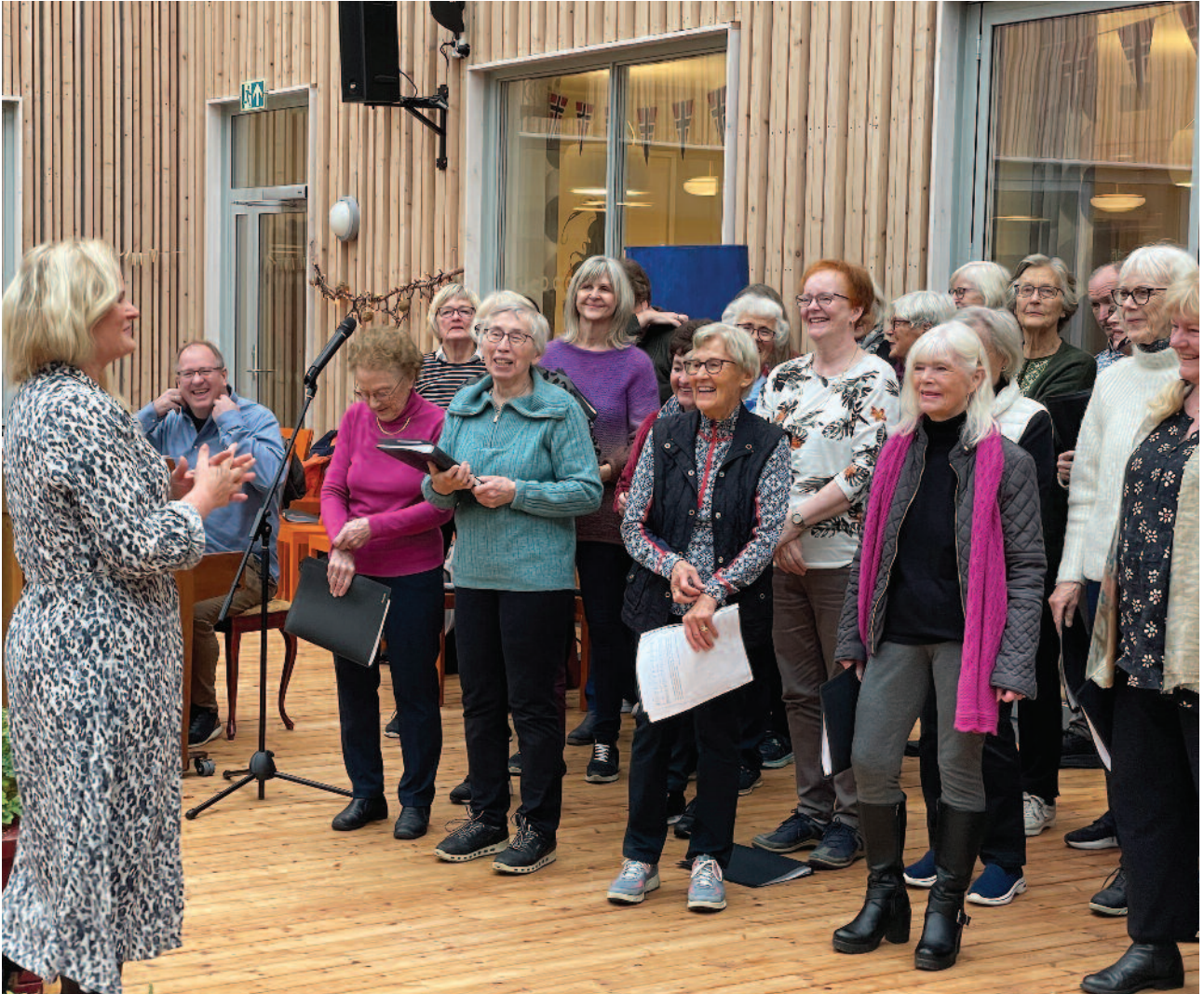
OPPTREDEN: Skjold Seniorkor opptrer til glede for beboere på Siljuslåtten sykehjem.