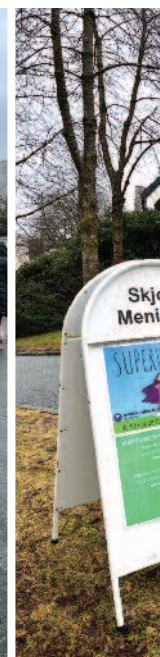
NY DAG: Fam vil videreføres men flyttes da