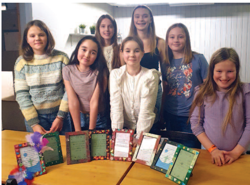
KREATIVE TWEENS: Flotte unge viser frem rammer de har pyntet og dekorert. Inne i rammen har de plassert en bønn.

LYS VÅKEN: En lørdag og søndag i mars deltok Tweens og noen andre unge på bo-hjemme-leiren Lys Våken. Vi hadde quiz, pizza, frokost, gudstjenesteverksted, og vi bakte nattverdsbrød til gudstjenesten. I gudstjenesten bidro Tweensene med lesing av bønnen, som forsangere på salmedans og dans. Dette ble en helg der vi undret, utforsket og lærte litt om hvordan vi kan være lys våkne for oss selv, for nærmiljøet, og for verden. Vi fikk også høre om hvordan Gud er lys våkne for oss.