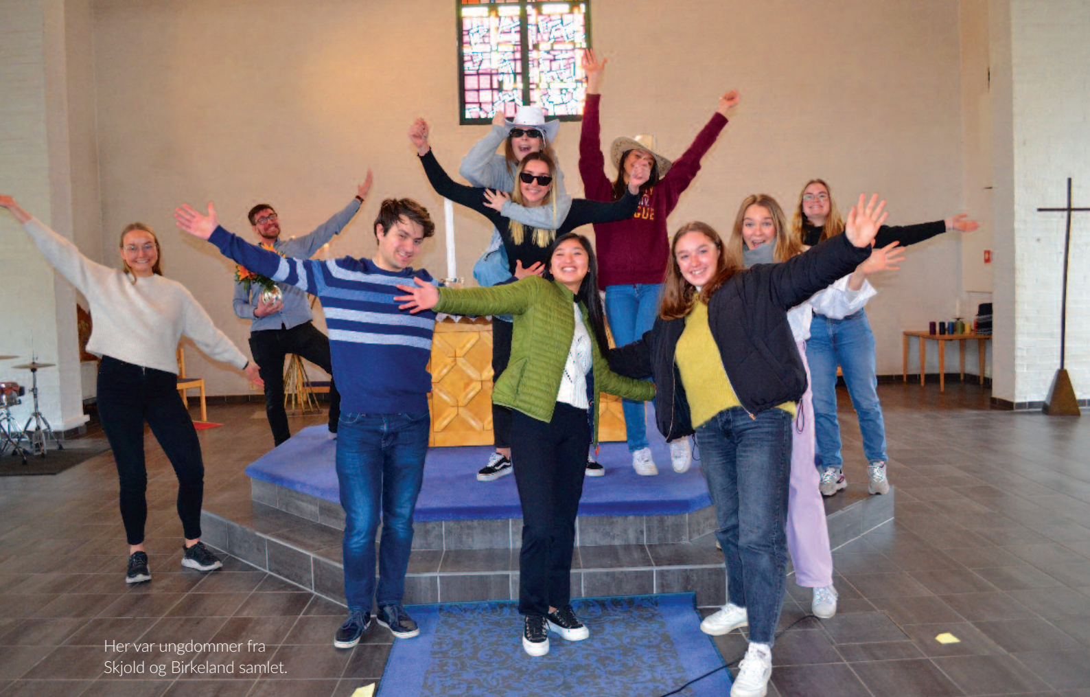
Her var ungdommer fra Skjold og Birkeland samlet.