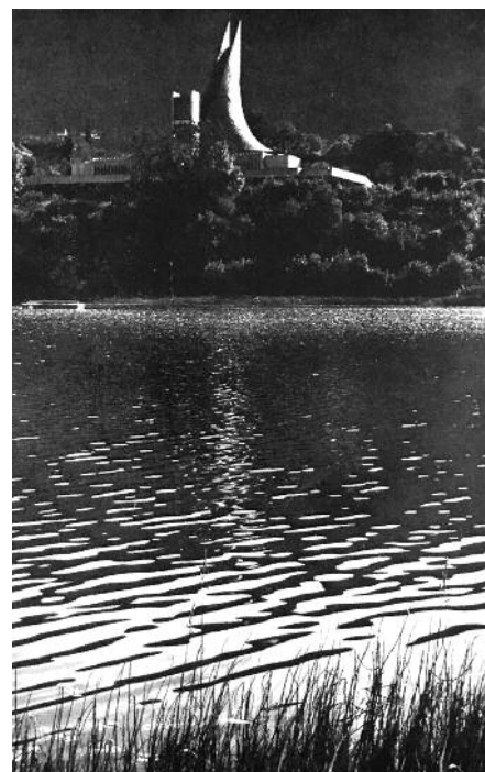
Fra Slettebakken menighetsblad 1970.