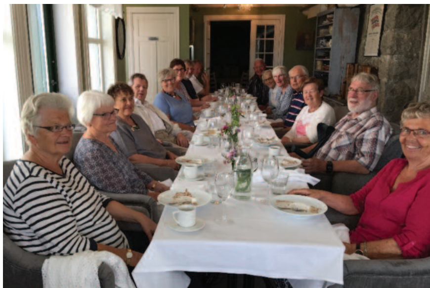
Glade middagsgjester på Haaheim gard.