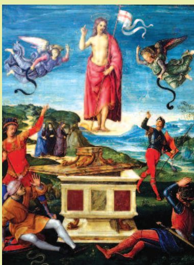
Renessansemeisteren Raphaels «Kristi oppstandelse», malt 1499–1502.

Bibellesninger hentet fra hendelsene fra palmesøndag til og med 2. påskedag vil veksle med salmer, korsanger og musikk. Gudstjenesten blir forrettet av kapellan Gunn Frøydís Unneland og kammerkoret Cantamo Storetveit deltar. ■