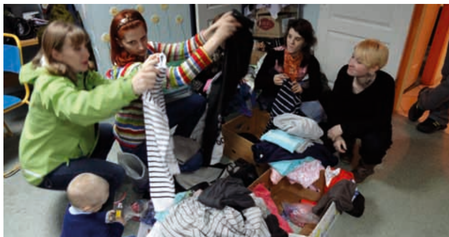
FIKK KLÆR: Jentene fra Arna hadde også med egne klær ned som de gav til mødre som trengte dem mer enn de selv.