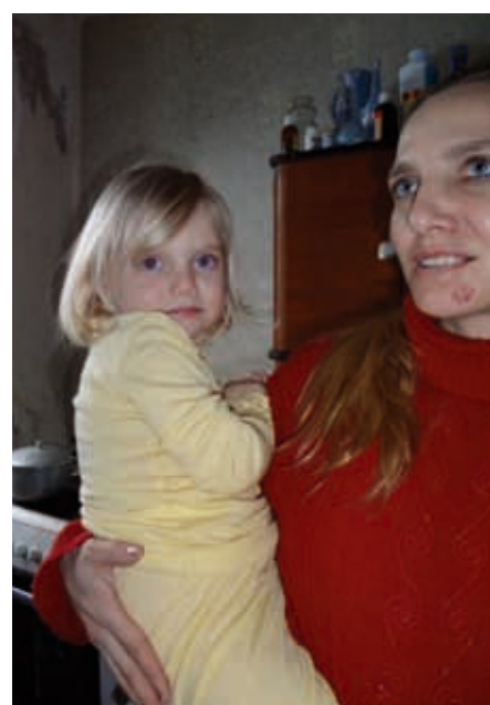
GAVE FRA JANUSFABRIKKEN: Vi hadde med 30 nye ullsett. Denne lille jenta her ble veldig glad for ulltøyet fra Janus.

Litt utenfor byen er det et sportssenter der de driver med en type bryting. Her instruerer en som har vært ukrainsk mester i bryting. Bryteklubben har vunnet mye i Ukraina, og gjør det bra. De har både brytesal og to treningsrom på senteret. Barna på dette senteret fikk ulltøy vi hadde fått med som gave fra Janus fabrikk.