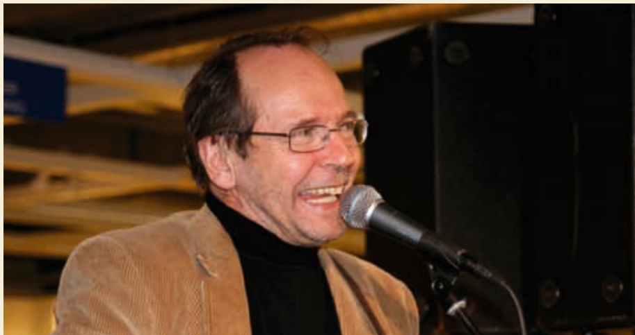
KJEM TIL ARNA: Ole Paus har alltid teke dei svakes parti, og har gjort mykje godt arbeid for Frelsesarmeen og Kirkens bymisjon. 21. juni kan du oppleve han i Arna kyrkje.

Midtsommarkveld med Ole Paus i Arna kyrkje, torsdag 21. juni kl. 20. Billett kr. 200,- ved inn- gang eller ved førehandssal på Arna kyrkjekon- tor.