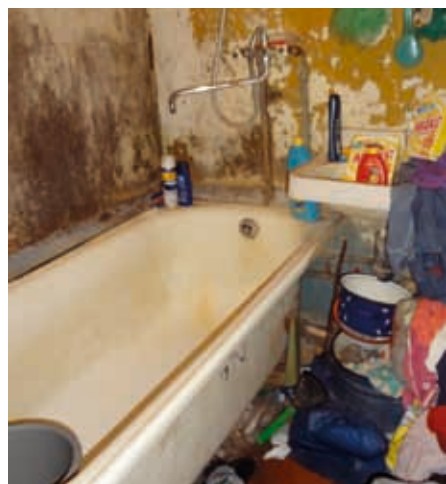
BADEVÆRELSE: Badet til en krisefamilie, her var det ikke vasket klær og det var mugg og sopp.

Tror alle er enig om at det var en vellykket tur. Vi som ikke hadde vært i Ukraina før har nok lært en del også. Vi ser hvor godt vi har det i Norge, og hvor lite vi vet om hvordan de har det i andre land.