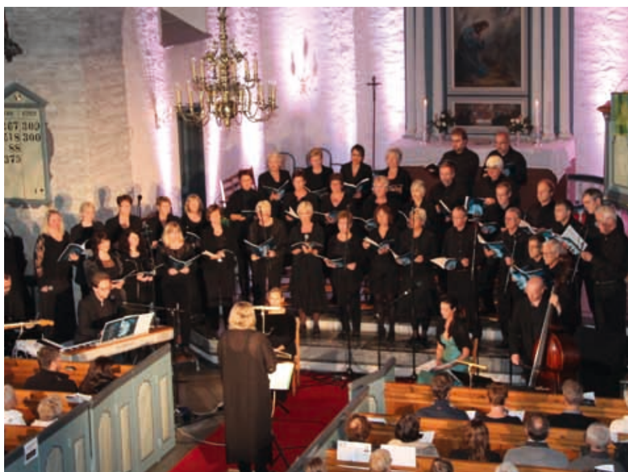
MESSE FOR MODER JORD: Arna kyrkjjes kammerkor nådde et foreløpig høydepunkt i fjor høst, da de fremførte Messe for en såret jord.

Gjennom de ti årene har vi fått mye glede tilbake fra vårt publikum, mange av dem trofaste tilhørere som har kommet igjen og igjen på konsertene. Vi har vært heldige, og vi er svært takknemlige. Vi vil også takke næringslivet i bydelen, som sammen med Arna kyrkjelyd og Kulturkontoret i Arna og Åsane har vært våre viktigste økonomiske støttespillere. Vi har et sterkt ønske om fortsatt å være en levende musikalsk kraft i vår bydel, og vi ønsker å fortsette vårt arbeid med å presentere mer av den store kirkemusikalske skatten. Derfor ønsker vi å knytte til oss flere som vil være med å syngne. Vi over onsdagskveldene i Kyrkjelydshuset. Ta gjerne kontakt!