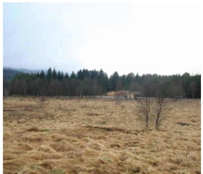
KLART FOR KIRKE: Dette området like ved Haukås skole er allerede avsatt til offentlige formål, og er foreslått som kirketomt.

Kontakt: Kirkens SOS i Bjørgvin, tlf 55 32 58 45 / mob 941 83 654 Epost: bjorgvin@kirkens-sos.no Mer info: www.kirkens-sos.no/bjorgvin