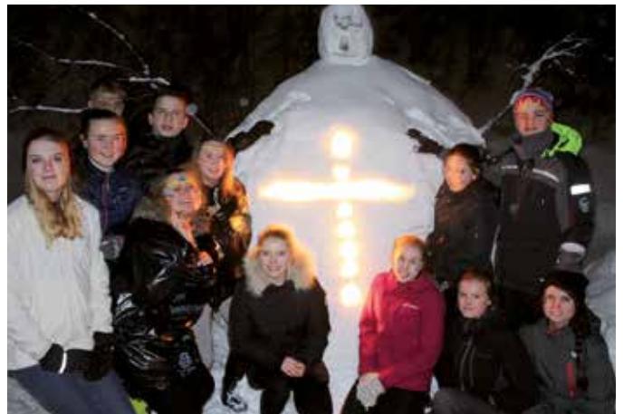
DEN BESTE SNØSKULPTUREN: Det vart laga ein kjempesnømann med lys i magen, plasserte så dei forma eit kors.

Ut på kvelden, etter andakt, er det tid for underhaldning. Her vart det song og musikk, hatteleikar og historiar. Mykje moro. Sondag er frukosten til same tid som laurdag, men no med endå fleire trøtte ansikt. Nokre av deltakarane har «døgna». Men før dei får reisa heim og sove ut er det tid for nok ei samling. Så skal det ryddast, pakkast og vaskast, og snart er leiren over for denne gong.