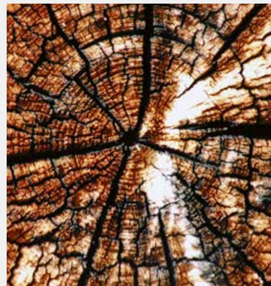
TIDLIG PÅSKEFEST I 2016: Årets påske kommer ekstra tidlig, med første påskedag allerede søndag 27. mars.

Bergen kirkelige fellesråds kulturutvalg retter en varm takk til kantorer/kulturarbeidere i Den norske kirkes menigheter i Bergen for det omfattende arbeidet som ligger bak hvert enkelt arrangement. Takk også til Bergen kommune for verdifull økonomisk støtte til Påskefest 2016. Vi ønsker alle en vel-signet påske, rik på gode opplevelser i våre kirker! Mer informasjon: www.paskefest.no og www.bergen.kirken.no .