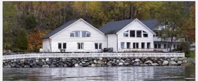
STILLA I NATUREN: Holmely ligg i sjøkanten, like ved riksveg 15 på Bryggja i Nordfjord, med flott utsyn mot fjell og fjord.

Store delar av laurdagen er sett av til pilegrimstur til øya Selja. Brosjyre er lagt ut på internettssidene til Bjørgvin bispedømme og Holmely ( www.holmely.no og www.retreater.no/retreatsted/holmely ). Pris per person: Dobbelrom kr. 2700,- / enkelrom kr. 2900,-.