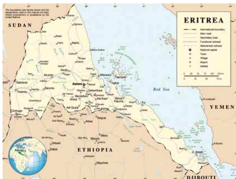
PÅ AFRIKAS HORN: Eritrea ligger nordøst i Afrika, med grenser mot Sudan i nordvest, Etiopia i sør, Djibouti i sørøst, og med kystlinje mot Rødehavet i øst.