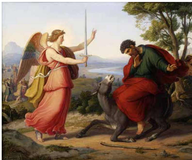
BILEAM OG ENGELEN: Eselet har sett engelen, men Bileam blir ikke oppmerksom på engelen før eselet snakker til ham.

Hva kan vi lære av denne historien? Flere ting: Det nytter ikke å forbanne det Gud vil velsigne, og motsatt, vi kan ikke velsigne det som Gud er i mot. Videre skal vi ikke tro på enhver kristelig lære selv om den kommer fra mennesker med fine titler og godt omdømme som taler profetiske ord. Men vi skal prøve alt, og undersøke om det stemmer med apostlenes lære som vi finner i Bibelen. Men framfor alt, vi skal frykte Gud, og holde hans bud.