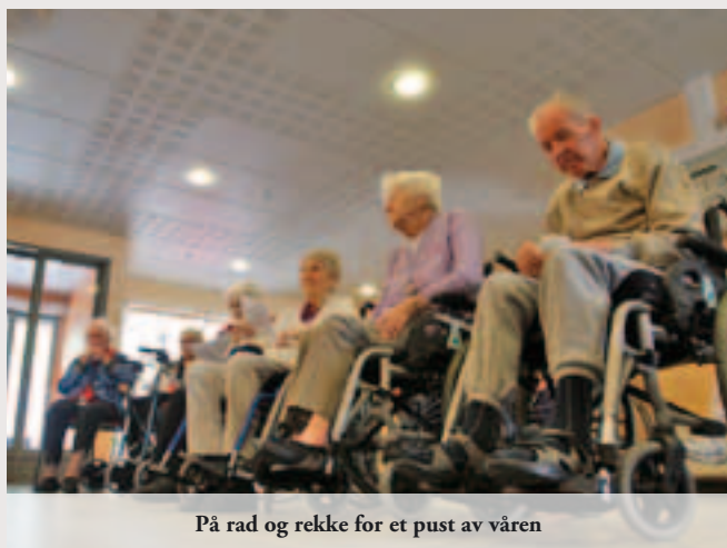
På rad og rekke for et pust av våren