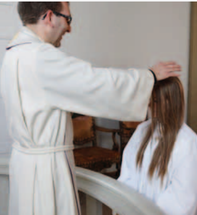
Jesus vil være med deg alltid