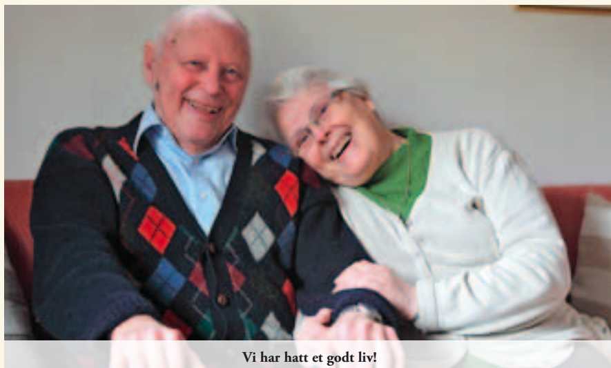
Vi har hatt et godt liv!