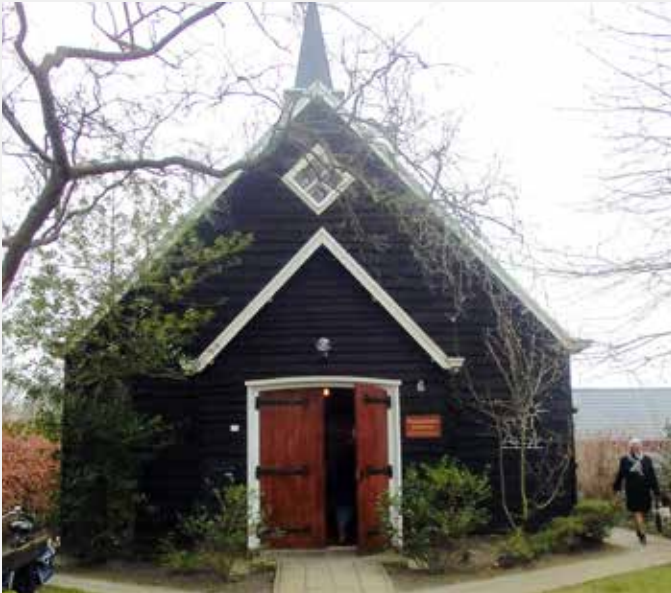
IDYLLISK LANDSBYKIRKE: Mellom villaene i Buitenpost ligger en nøktern, men særdeles innbydende liten kirke.

Kirken ble bygget like etter krigens slutt i 1945, da rundt 20 unge idealister (noen av dem fra USA) kom til Buitenpost. Noen var militærnekttere med alternativ tjeneste, andre var bare reiseglade og eventyrlystne.