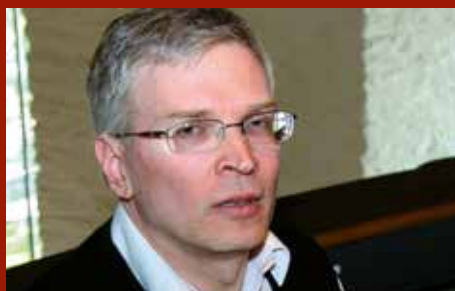
Ny spelemann på orgelkrakken Side 3

No kan ungdomane i Ytre Arna velja å ha konfirmanttida i kyrkjås eige band. Side 2.