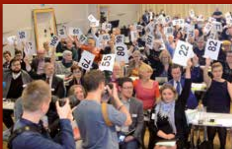
Historisk kyrkjemøte Side 12-13