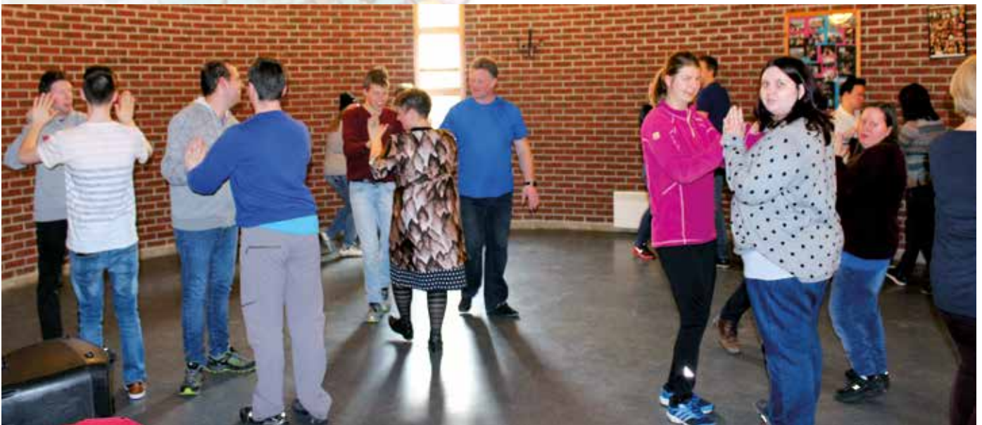
Noen av kunstnerne.

Kunstverkene er laget av medlemmer av Klubb + og Klubb x-tra, som kommer fra hele Åsane og samles i Åsane kirke til ulike aktiviteter. Du finner bilder med en spontanitet og kreativitet du sjelden ser på andre kunstutstillinger. Ikke se på bildene som bilder laget av unge med forskjellige handikap, men nyt følsomheten og varmen i bildene. Ta deg tid, og du vil få en stor kunstoplevelse.