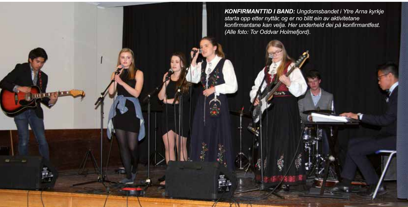
KONFIRMANTTID I BAND: Ungdomsbandet i Ytre Arna kyrkje starta opp etter nyttår, og er no blitt ein av aktivitetane konfirmantane kan velja. Her underheld dei på konfirmantfest.

Hunhammer. Dei har øvd mykje og ofte for å opptre på samtalegudstenesta og på konfirmantfesten. Skikkelig flinke har dei blitt, og eg er kjempestolt av bandet vårt! Tusen takk til soknerådet som har støtta oss heile tida!