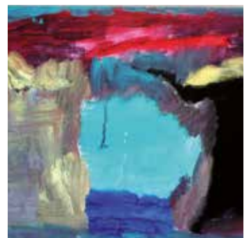
Den blå grotte (Øystein)