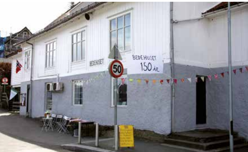
Bedehuset i dag.