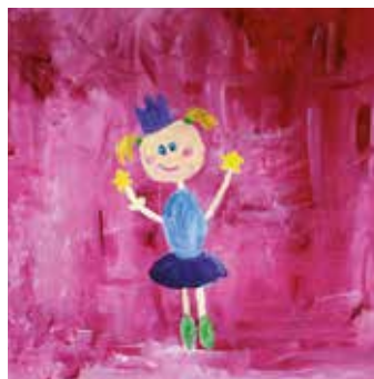
Gla for å se deg