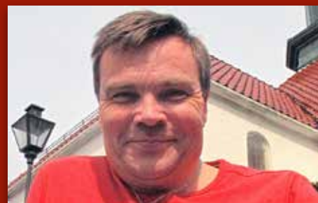
TGIF: Gode verdjar på livsvegen Side 6