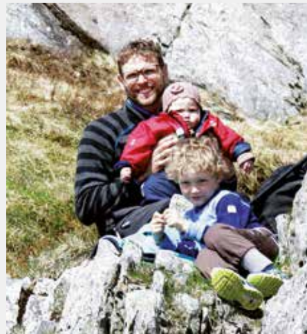
FOR ALLE GENERASJONAR: Aldersforskjellen på deltakarane var på over 90 år.