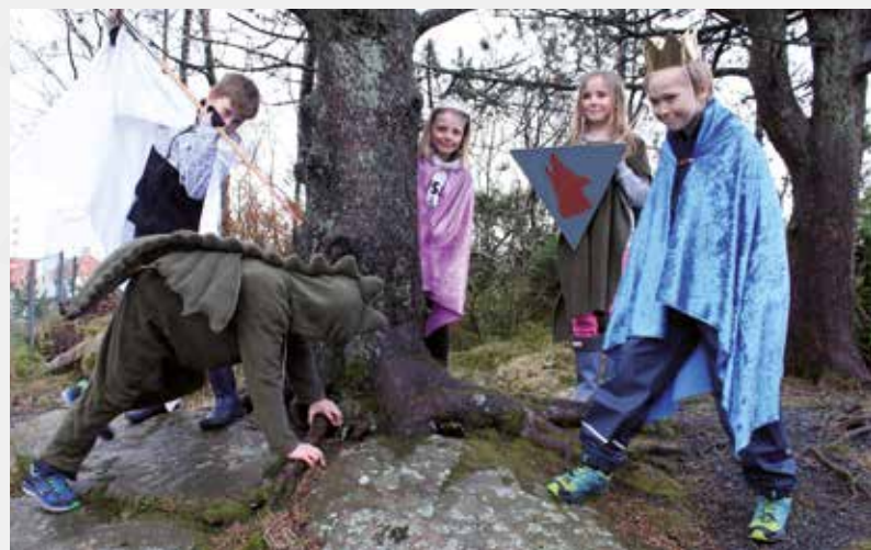
DRAMATISK KAMP: St. Georg er i kamp med dragen, den redde prinsessen har delvis gjemt seg bak et tre, væpneren avventer situasjonen, mens kongen følger spent med på kampen.

I fortellingen kan dragen stå for vondskapen og urettferdigheten i verden, mens Georg kan stå for hjelpsomhet, mot, dyktighet og frimodig tro. Da blir fortellingen ganske tankevekkende og virkelighetsnær. For speiderne over hele verden er St. Georg et forbilde, og han illustrerer på en god måte både speiderlov, løfte og valgspråk.