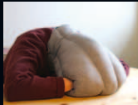
POPULÆRT POLITIKERPLAGG: Strutseputa selges for 400 kroner. Med den på kan du verken se, høre eller gjøre noe.