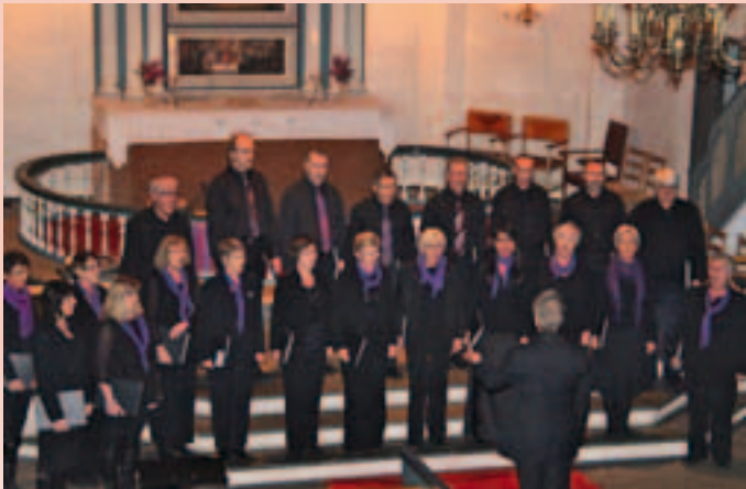
JULEKONSERT: Kammerkorets årlige julekonsert er blitt en tradisjon. Bildet ble tatt under konserten i 2011.