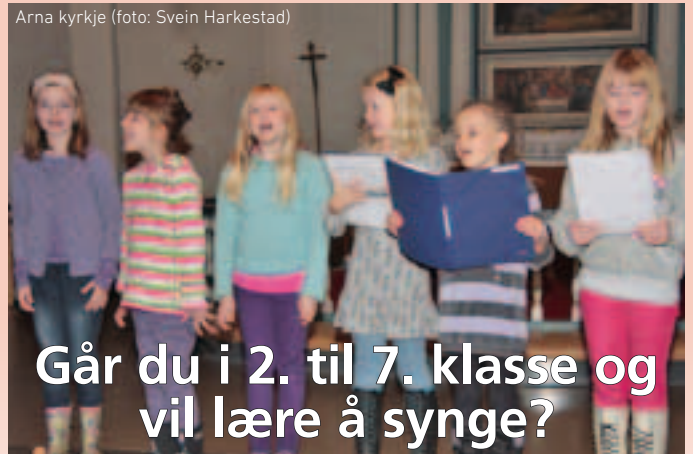
Arna kyrkje