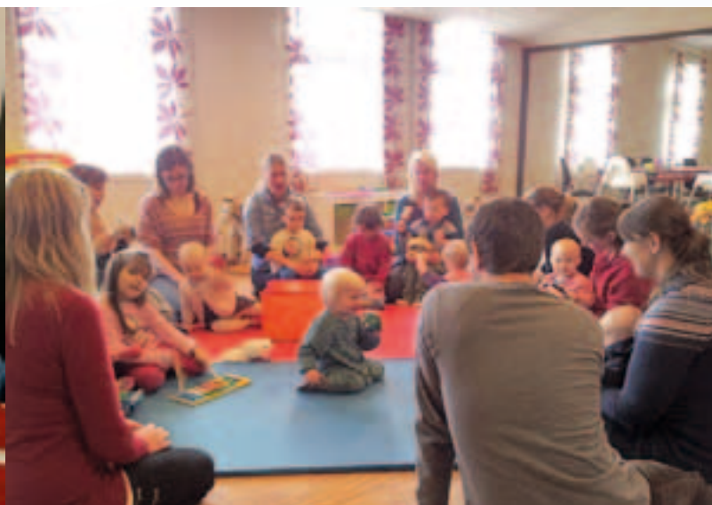
Samlingsstund i Noa åpen barnehage.