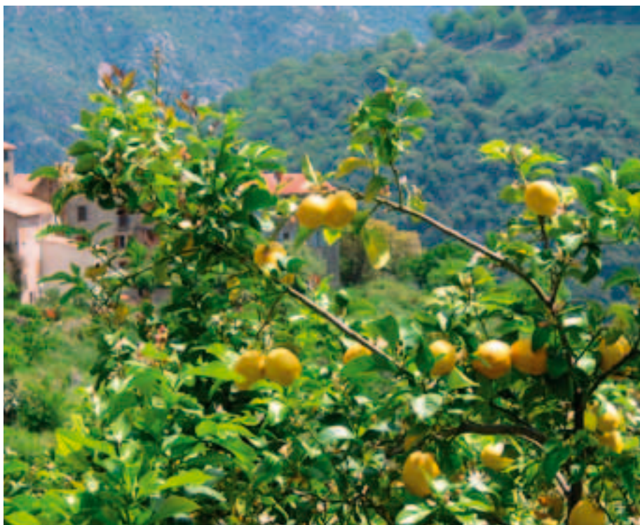
FRUKTTRE: Biletet viser eit sitrontre fotografert på Korsika.

Med vennlig hilsen Undervisningskomiteen.