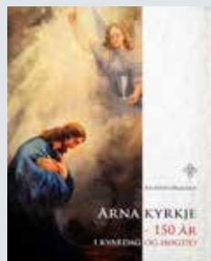
Forsida til jubileumsboka. (Forsidefoto: Jon Tesdal)

Jubileumsboka «Arna kyrkje – 150 år i kvardag og høgtid» kostar 350 kroner, og kan kjøpast på Arna kyrkjekontor og Arna Libris, Øyrane Torg. «Informative tekstar og mange bilete gjer jubileumsboka «Arna kyrkje – 150 år i kvardag og høgtid» til ei særst flott bok». – Tor Kristiansen, Bergen kirkelige fellesråd.