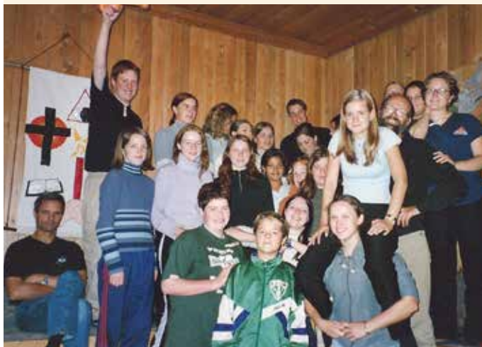
DEN GANG DA: Vi håper at mange ønsker å komme for å feire at vår kirke i Arna fyller 150 år, og bidra til at Ten Sing-toner igjen fyller kirken.