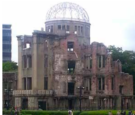
ATOMBOMBE-KUPPELEN: Denne bygningen var den eneste nær nullpunktet som ikke ble jevnet med jorden av atombomben over Hiroshima

andre land, ble vi også godt kjent med de andre i vår egen tropp. For oss som har forberedt og gledet oss til dette i flere år, er det rart at det hele nå er over. Vi har vært med på noe helt spesielt, som vi sannsynligvis aldri kommer til å oppleve igjen. Vi sitter igjen med nye venner, opplevelser og minner for livet.