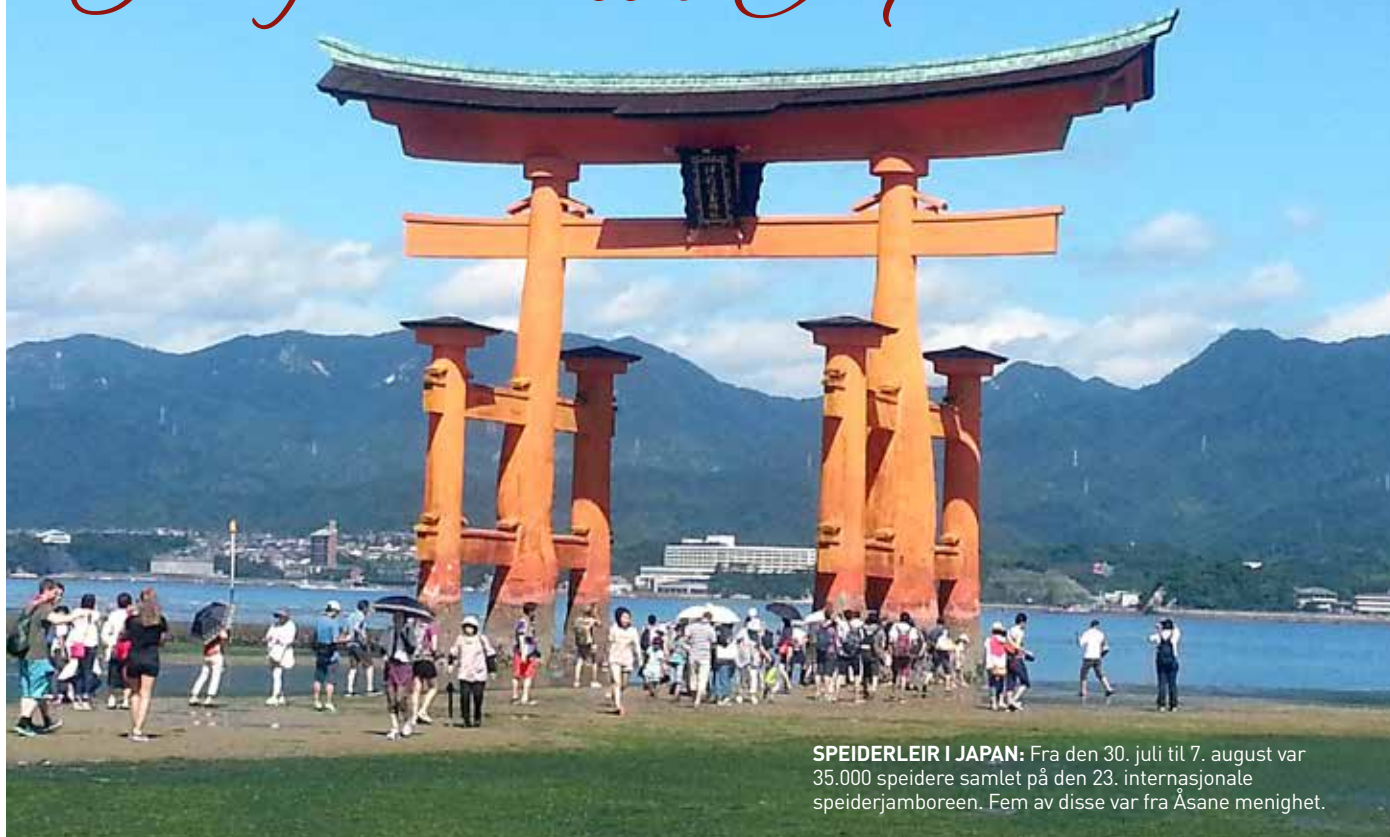
SPEIDERLEIR I JAPAN: Fra den 30. juli til 7. august var 35.000 speidere samlet på den 23. internasjonale speiderjamboreen. Fem av disse var fra Åsane menighet.