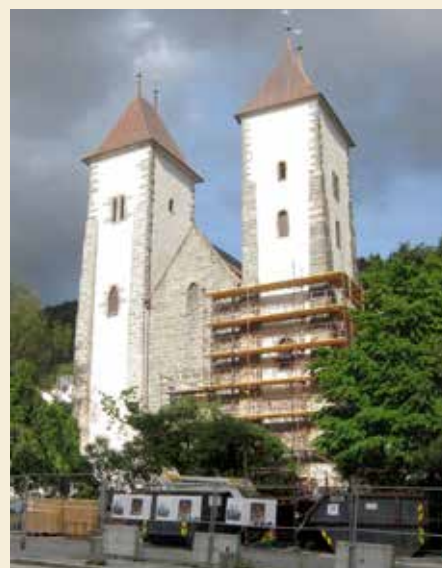
RESTAURERT: Mariakirken, som er den eldste bevarte bygningen i Bergen, ble gjenåpnet i sommer etter å ha vært gjennom en omfattende restaurering.