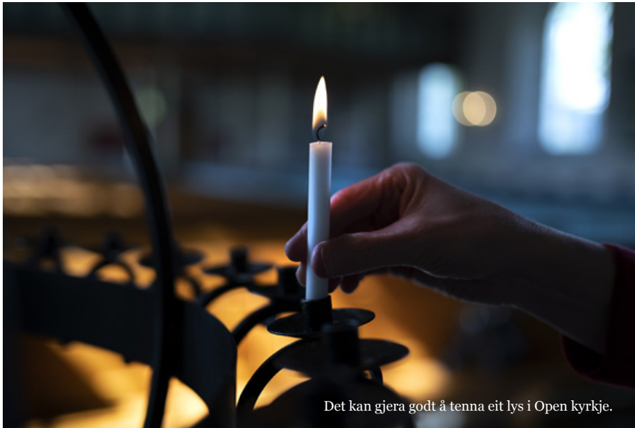
Det kan gjera godt å tenna eit lys i Open kyrkje.