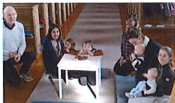
Påskevandring med fotvask og polarbrød

Ein familie på flukt frå krigen i Ukraina fann vegen til Noa i mars. Måten dei vart mottekne på av dei andre foreldra synleggjorde samhaldet og varmen i foreldregruppa. Foreldregruppa og andre i bygda samla raskt saman klede, mat og leiker til familien.