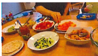
Glimt frå livet i Noa: tacolunsj, maleaktivitet, barnesong i kyrkja og førjulsfest med nissebesøk!

Høgtidene vart markert på ulike måtar, blant anna med påske- og julevandringar i kyrkja. Det er veldig kjekt at dei som kjem i Noa får møte både stab og frivillige i kyrkja!