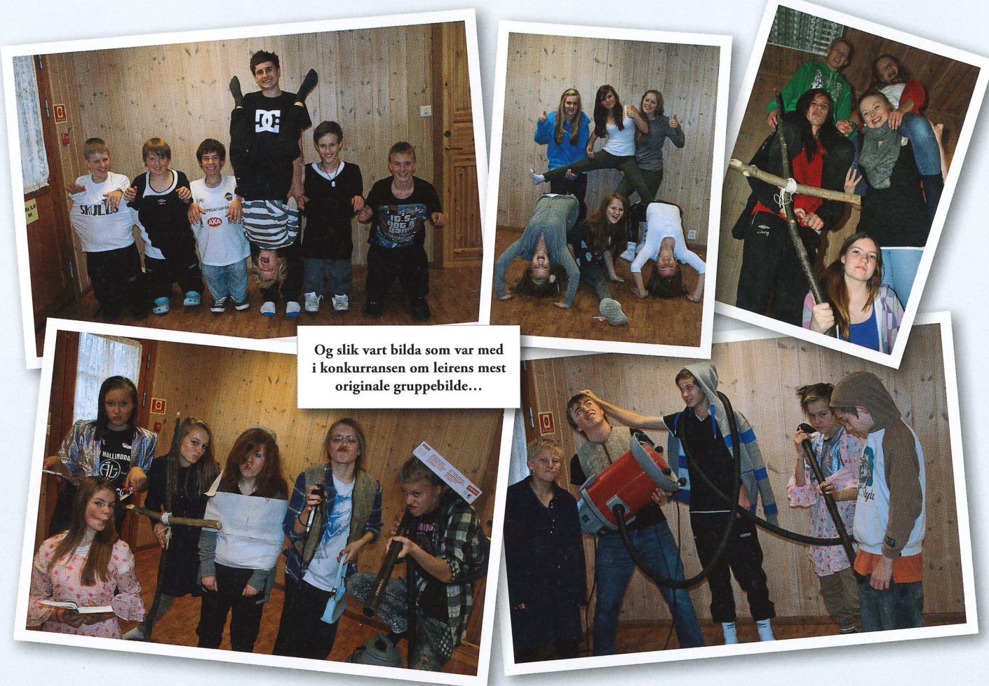
Og slik vart bilda som var med i konkurransen om leirens mest originale gruppebilde...

Siste helga i oktober var vi 29 konfirmanantar frå Ytre Arna og 14 (!) leiarar som sette kursen mot Wallemtunet på Kvamsskogen for konfirmantleir. Wallemtunet er ein god stad å vere. Vi er etterkvart mange i Ytre Arna som har gode minner frå derifrå.