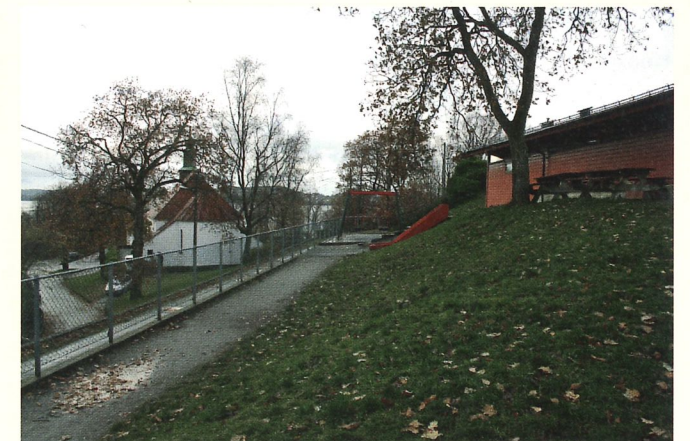
Salhus barnehage er nærmeste nabo til Salhus kirke.

lest fra ulike bøker av Simon Flem Devold, boka om den lille engelen Ariel og bøkene om Pulverheksa.