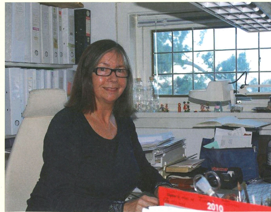
Kunstneren i sitt hjemmekontor på Tertnes.