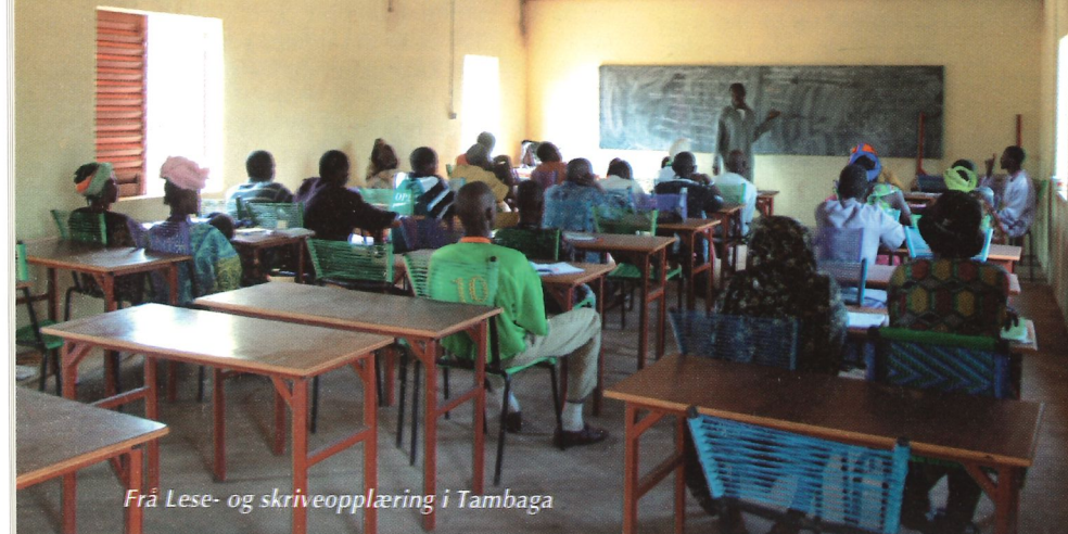
Frå Lese- og skriveopplæring i Tambaga