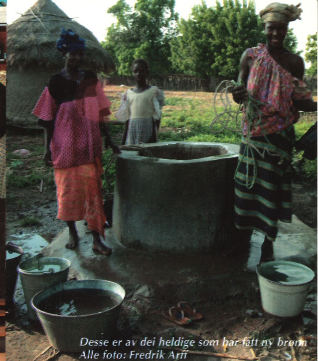
Desse er av dei heldige som har fått ny brønn

Det nærmar seg no 2 år sidan Ytre Arna kyrkjelyd valde misjonsprosjekt – Malinkè-folket i Mali i Vest-Afrika der Normisjon har arbeid. Veldig mykje har skjedd sidan den tid, og det er no på tide med ei oppdatering.