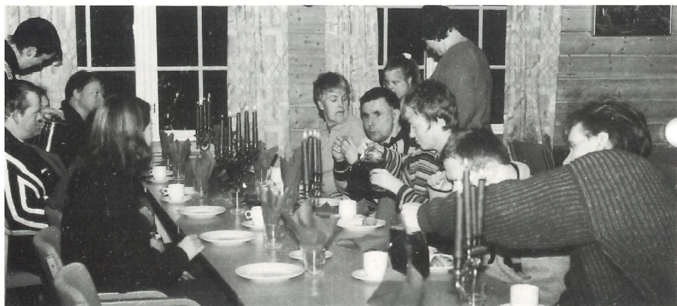
Matøkta er eit viktig programinnslag når dei psykisk utviklingshemma i Arna samlast til klubb- kveld.