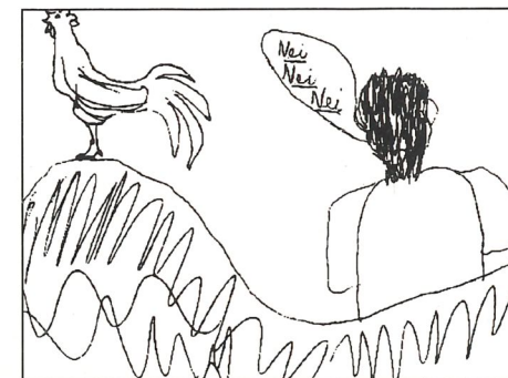
Peter, Jesu disippel, angret da det gikk opp for han at han hadde sveket mesteren.

– Men det ble sagt at du Peter fornektet Jesus? – Ja det gjorde jeg, selv om jeg hadde lovet Jesus tidligere på natten at jeg ikke skulle gjøre det. Så gjorde jeg det 3 ganger mens jeg satt ute på gårdsplassen hos øverstepresten Kaifas. – Da kom jeg på det som Jesus hadde sagt tidligere på kvelden, at før hanen galer, har du fornektet meg 3 ganger. Da ble jeg svært lei meg. – Hva skjedde etter at Jesus døde på korset? – Som dere vet stod han opp fra de døde tredje dagen. – Når traff dere på han igjen? – Han kom til oss mens vi var samlet i en landsby og var med oss der. – Vi trodde først det var en ånd, men da han begynte å spise og vi fikk ta på han skjønte vi det var Jesus. Da forstod vi at det som stod i Moseloven hos Profetene og i Salmene var gått i oppfyllelse. – Hva har du gjort på siden? – Siden har jeg drevet på med misjonsarbeid i Lille Asia og grunnlagt mange menigheter. Jeg har jogså hatt besøk av Saulus, men nå kaller han seg Paulus. – Jeg døpte også den første hedningen. Vi ønsker deg lykke til i hans arbeid for å få flere til å komme til å tro på Jesus.