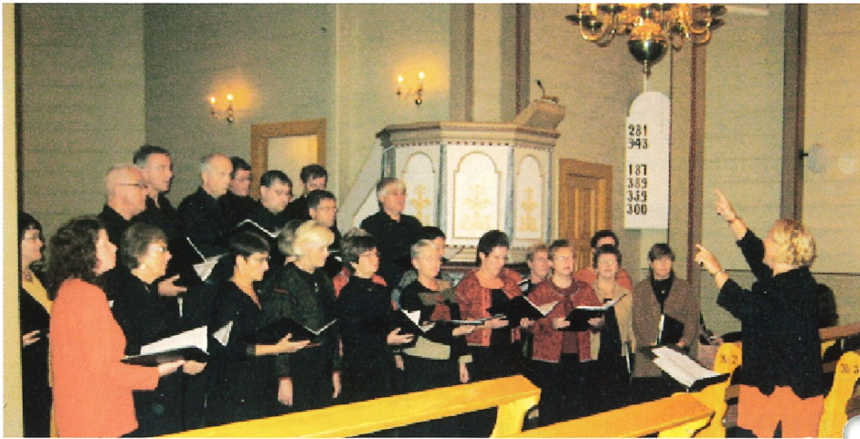
Spentig på vesle julaften