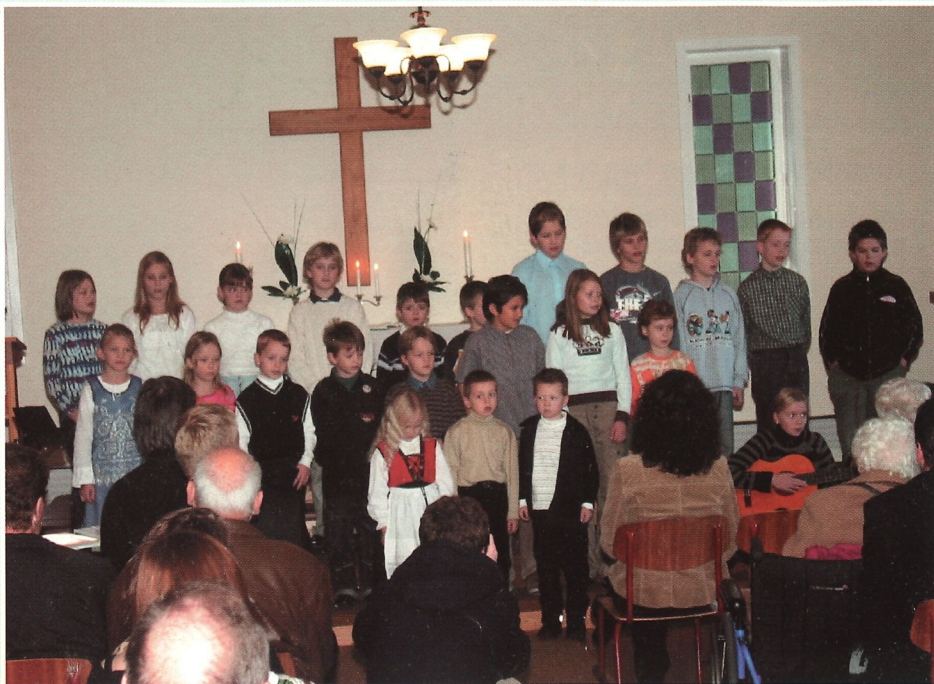
Barna på Trengereid skule sang under gudstjenesten i det nyoppussede bedehuskapellet.