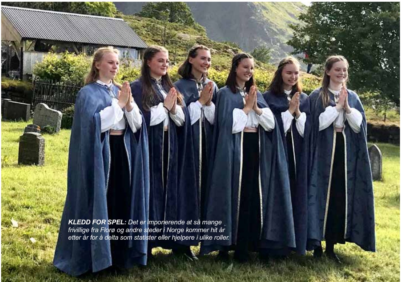
KLEDD FOR SPEL: Det er imponerende at så mange frivillige fra Florø og andre steder i Norge kommer hit år etter år for å delta som statister eller hjelpere i ulike roller.

Båtene drev altså inn til hver sin øy på Vestlandet, og til Kinn kom Borni. Hun skal ha bodd i en heller i fjellet bak der kirken senere ble bygget. Kinnaspelet er bygget på denne historien.