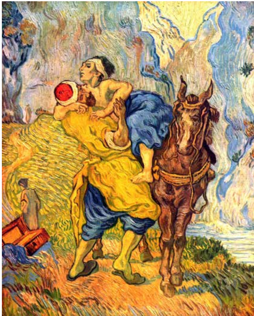
DEN GODE SAMARITANEN: «Dine gode gjerninger følger deg som en usynlig hær, helt til du begynner å snakke om de. Da forsvinner de som dugg for solen» heter det i et fransk ordtak. (Illustrasjon: «Den gode samaritanen», oljemaleri av Vincent van Gogh)

Hovedfokuset under ramadan er på god moral, og særlig det å tenke på og hjelpe andre enn seg selv gjennom gode gjerninger, ærlighet, godhet og kunnskap. Vi kristne har også