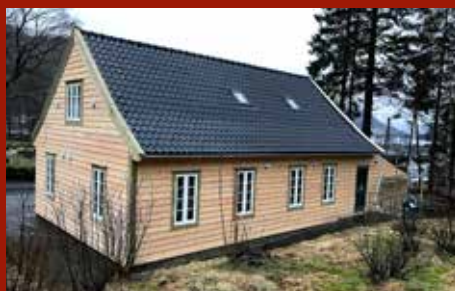
Borgstova er nyoppussa

Bli med på gudsteneste ved Redningshytta på Gullfjellet 2. pinsedag. Sjå side 4.