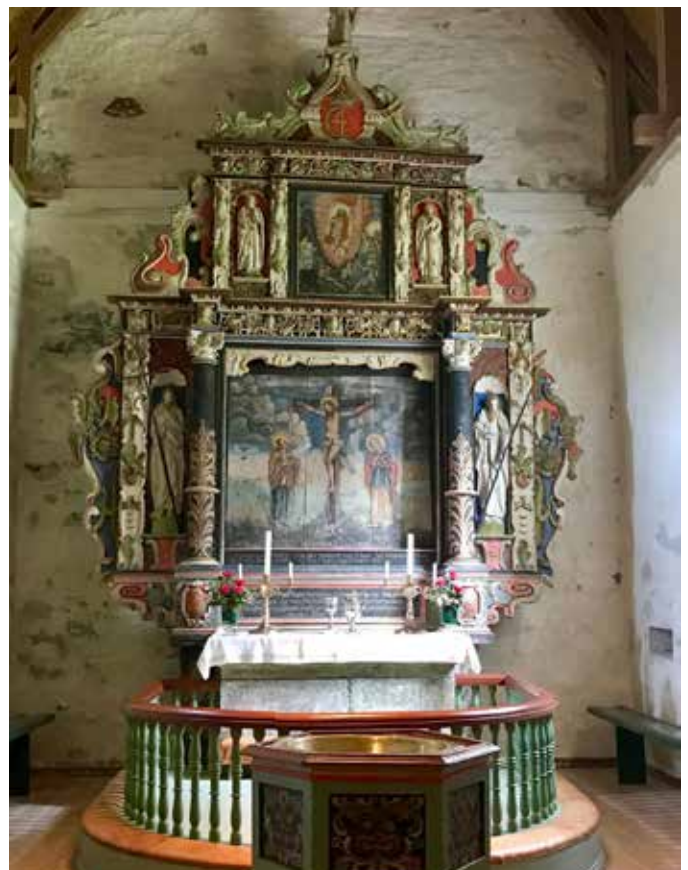
GAMMEL ALTERTAVLE: Altertavlen i Kinn kirke ble bygget om til nåværende form i 1703, med korsfestelsen og oppstandelsen som hovedmotiv. Midtpartiet er et gammelt helgenskap fra middelalderen.

Kinnaspelet, med tittelen «Songen ved det store djup», blir i år fremført 22. og 23. juni. Mer informasjon: kinnaspelet.no