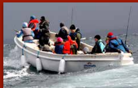
Bli med til Øygarden