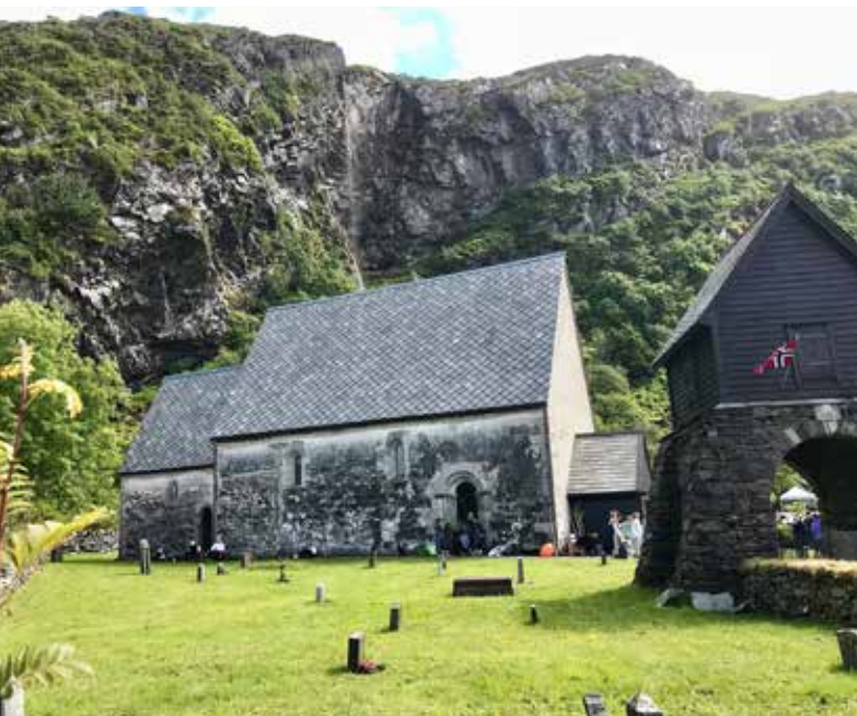
KINNAKYRKJA: Den gamle steinkirken på Kinn ble bygget en gang mellom årene 1150 og 1200.

TEKST OG FOTO: SYNNØVE NORSTRAND OG BJØRN NORSTRAND