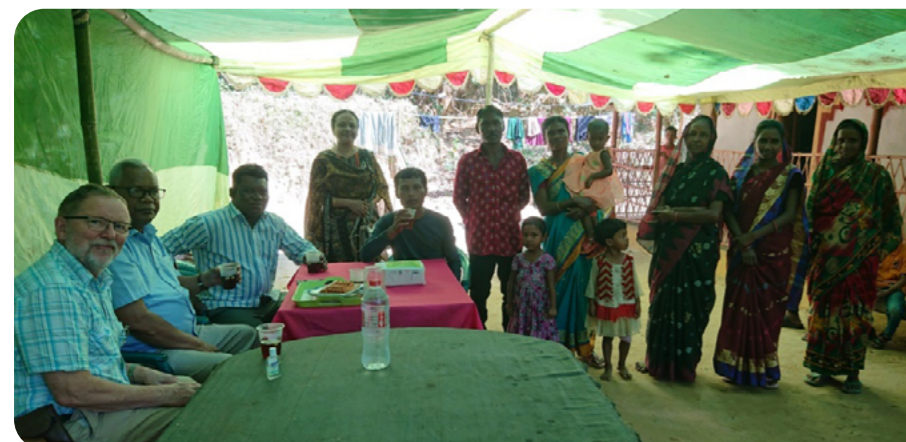
Velkomst med te og kaker