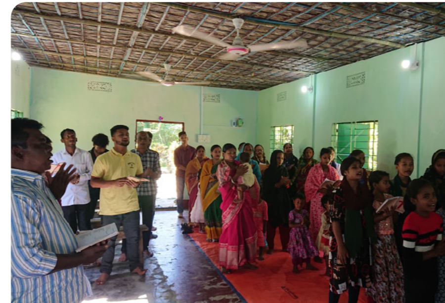
Frå gudstenesta i kyrkja