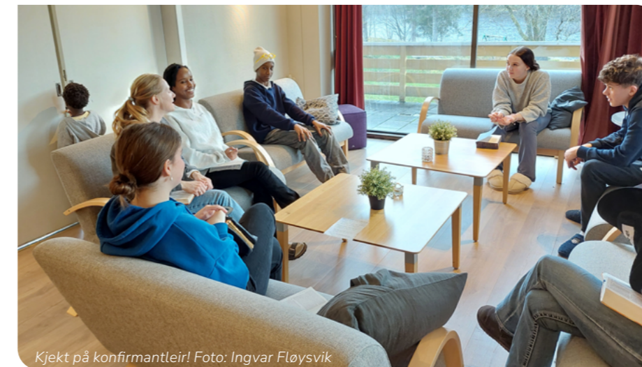
Kjekt på konfirmantleir!

Alle som er døypte medlemmer av Den norske kyrkja, fødte i 2011 og folkeregistrerte i Ytre Arna, får i byrjinga av mai brev med registrerings skjema. Her får du òg fleire detaljar om konfirmantåret. Viss du ikkje er døypt, dersom du er medlem av eit anna kyrkjesamfunn, eller om du bur utanfor Ytre Arna sokn, men ønskjer å bli konfirmert i Ytre Arna, tek du kontakt med presten, Ingvar Fløysvik, anten på tlf. 916 06 626 eller e-post if952@kyrkja.no , så sender me skjema til deg òg. Skjemaet vil òg liggja på nettsida vår, kyrkja.no/ytrearna . Bruker du PC, finn du «Konfirmasjon» over hovudbiletet, går du inn på sida via mobil, trykkjer du på menytrekane over biletet for å få det fram.