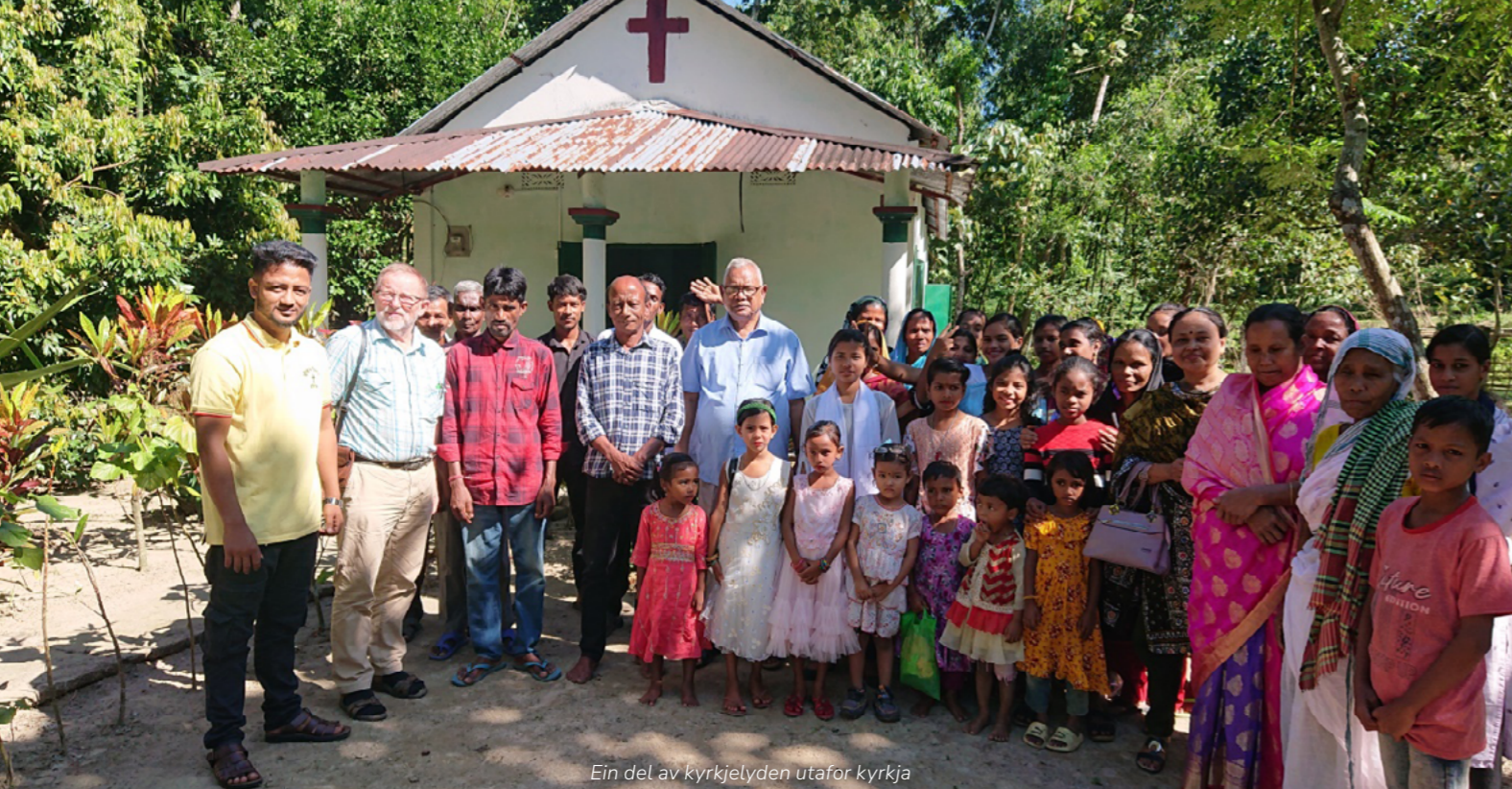
Ein del av kyrkjelyden utafor kyrkja