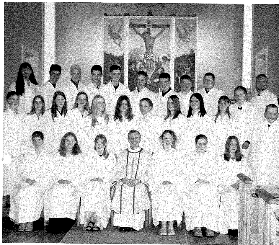
Vårens konfirmanter i Ytre Arna, fotografert etter overhøringsgudstjenesten søndag 6. april.