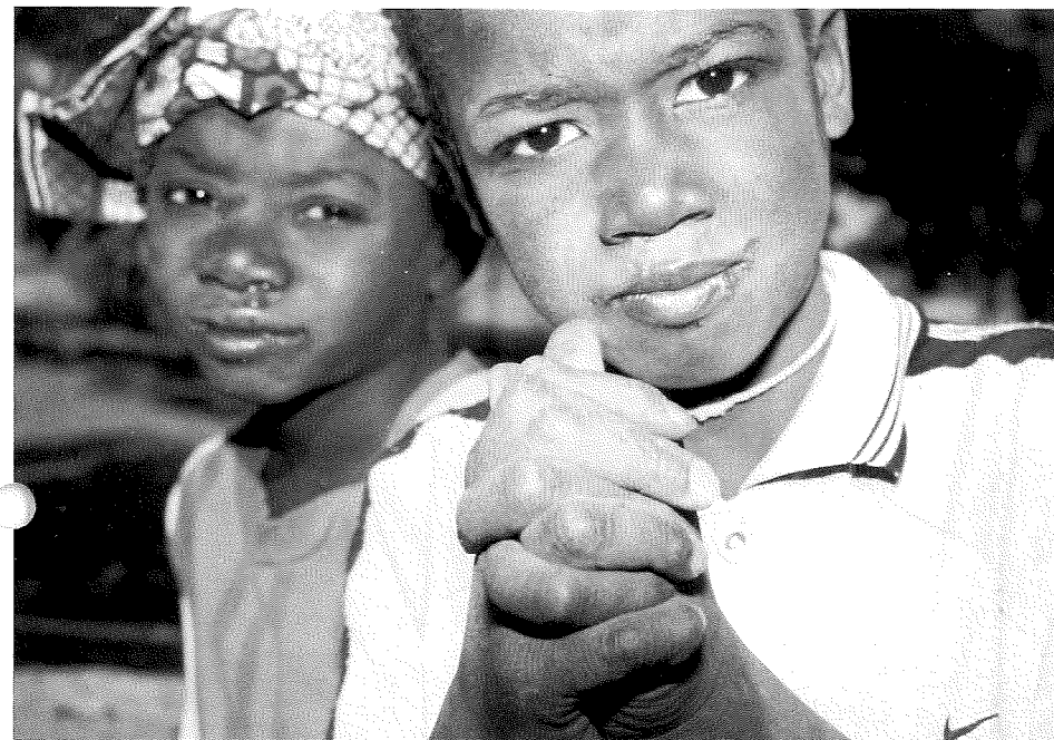
Ytre Arna sokneråd valt misjonsprosjekt, og kyrkjelyden vil støtte arbeidet blant Malinkè-folket i Mali, Vest-Afrika gjennom Normisjon.

Misjonærane er støttespelarar i oppstartsarbeidet.