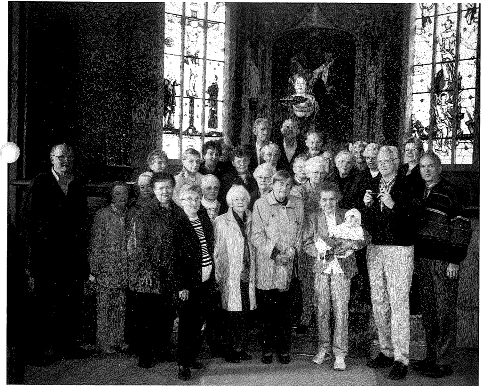
Heile flokken i Jondal kyrkje.