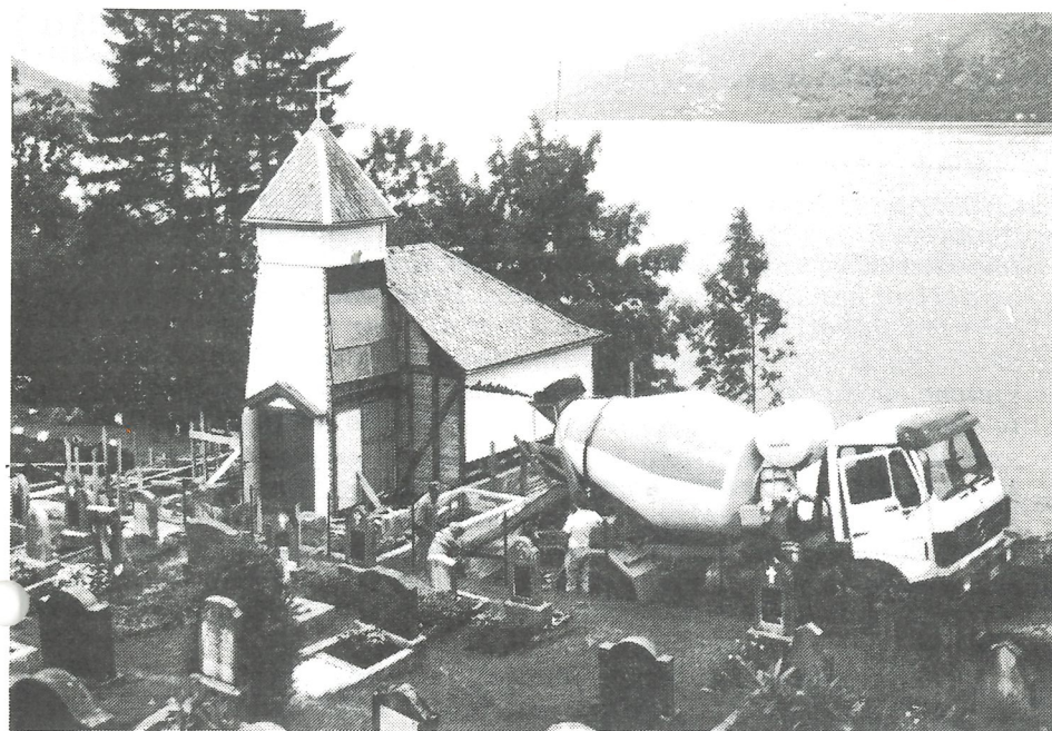
Byggjearbeid på Takvam kapell.