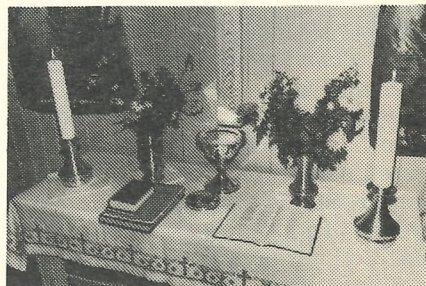
Det nye altaret i kapellet.