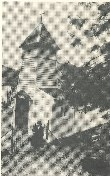
Takvam kapell er med sine 50 sitjeplassar truleg det minste kapell i Norge.