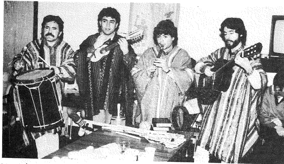
Musikkgruppa «Malku» i Kyrkjelydshuset i Ytre Arna ved fellesarrangement mellom knerådet og chilenske asylsøkjjarar 25.11. Sjå side 13