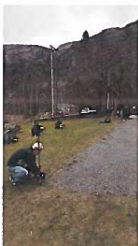
Reinsking av Grusgang på dugnad