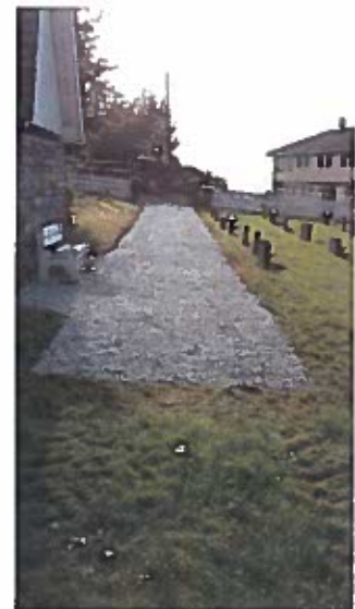
Ny grusgang – på dugnad