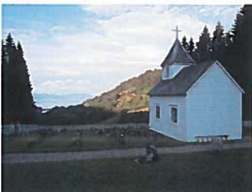
Utsikt frå gravplassen og nedover til bygda.

Oversiktsbilete over Baldersheim gravplass. Nærast ser ein den utvida delen av gravplassen som vart utført i 2017.