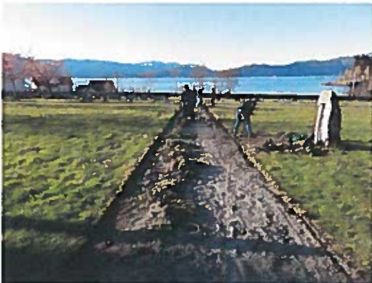
Oversikt frå kyrkja mot sjøen