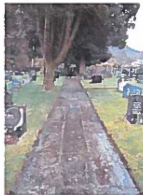
Delar av hellegangane etter dugnad