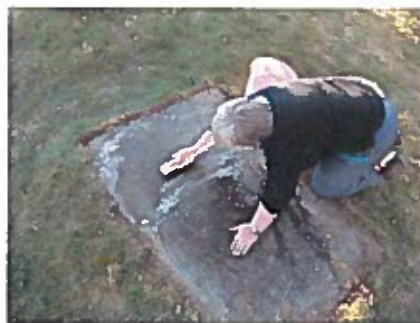
Vask av gamle gravminne