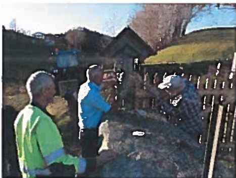
Reparasjon av mur og gjerde på dugnad