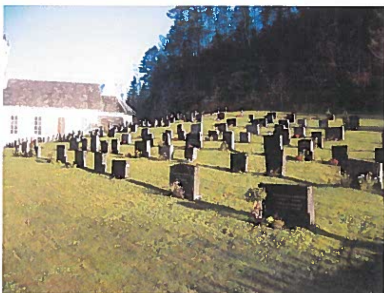
Oversikt over delar av kyrkjegarden på Eide

Spesielle behov i 10-årsperioden: Utviding eller nytt areal i 2021-2022.