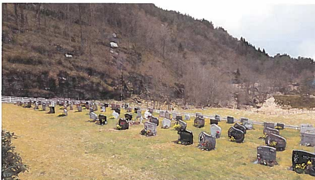
Oversikt over nedre del av kyrkjegarden.

Spesielle behov i 10-årsperioden: Plan om utviding pågår. Utviding skjer i 2019-2020.