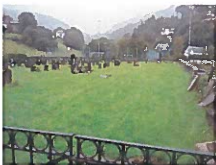
Ein av dei to portane til gravplassen