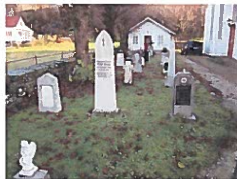
Gravmannelunden i Strandvik