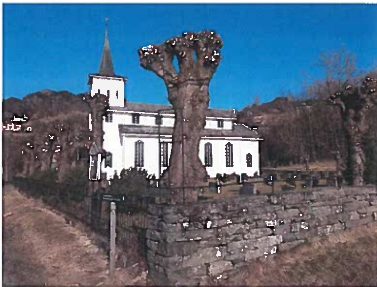
Strandvik kyrkjegard. Trea er nett styva på dugnad.