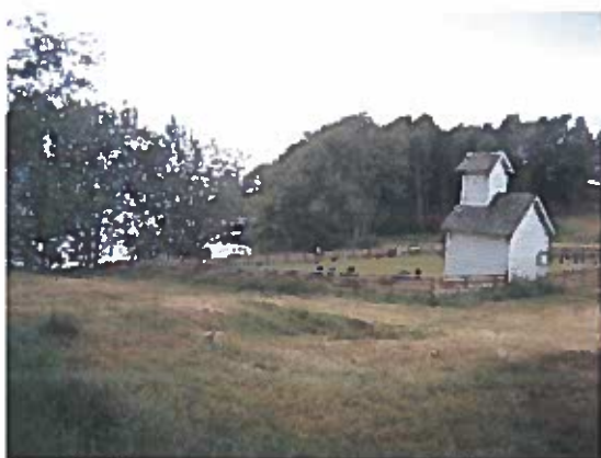
Oversikt over gravplassen