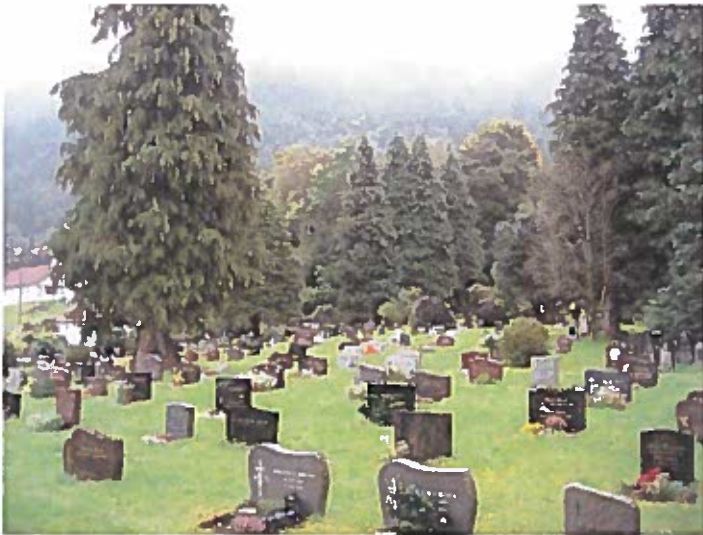
Oversiktsbilete over delar av Fusa gamle kyrkjegard