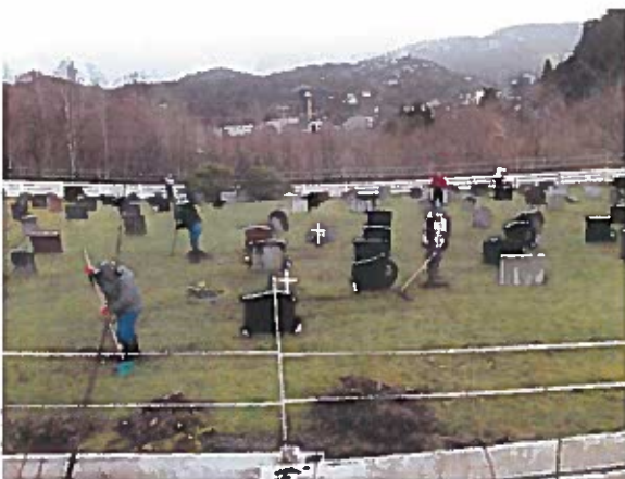
Dugnadsgjengen på vârdugnad!