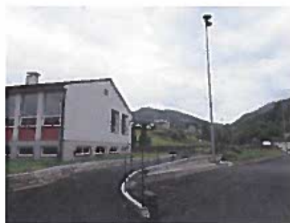
Ny tilkomst til Aakre gravplass i 2017