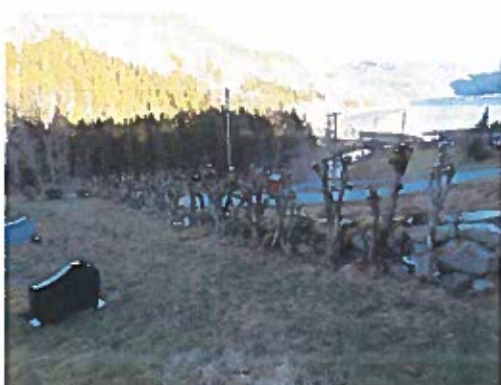
Hekk klipt på dugnad