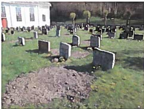
Påfyll av jord på dugnad