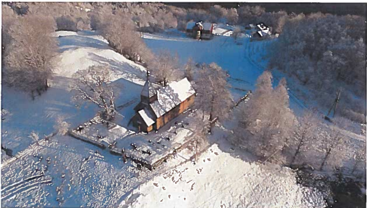
Oversiktsbilete av Holdhus kyrkje og kyrkjegarden

Andre kommentarar: Lite jordmassar på det meste av området. Fellesrådet eig gravplassen , fortidsminneforeningen eig kyrkja.