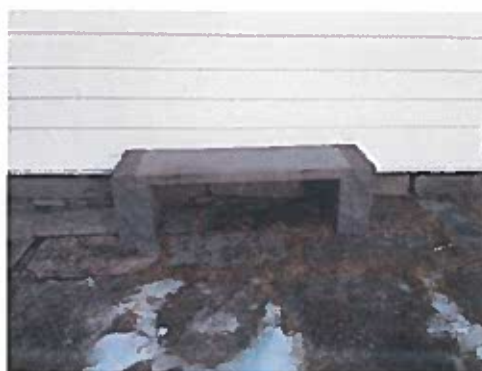
Ein av to nye steinbenkar i 2017 – gitt av næringslivet.