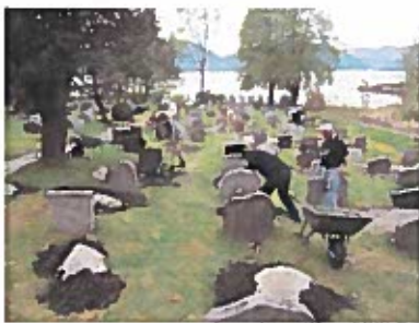
Påfyll av jord på dugnad