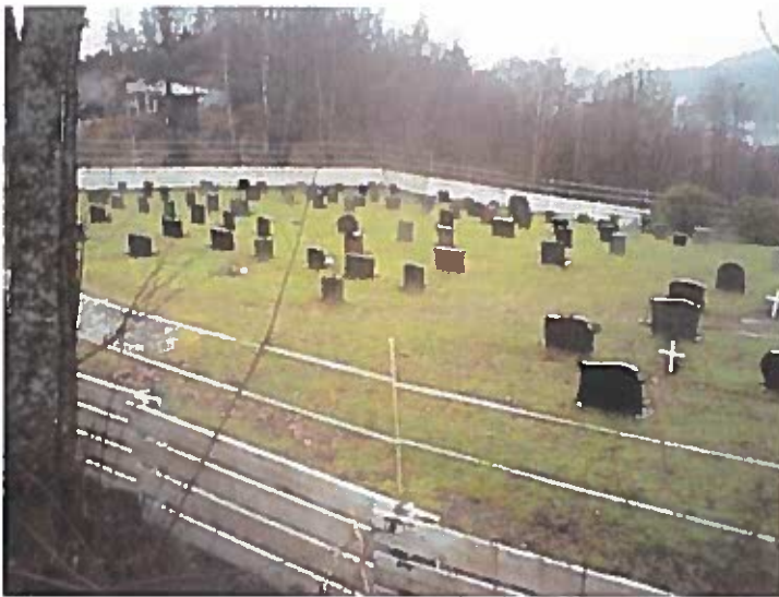
Oversiktsbilde Nordtveit gravplass. Sikring over gjerde pga hjort.