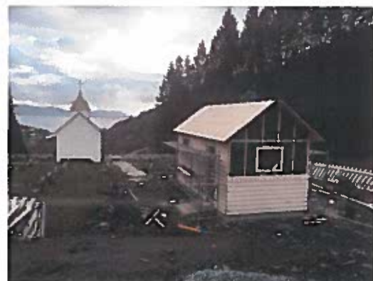
Reiskapsbygg og toalett under bygging i 2016.