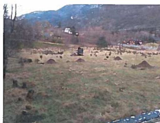
Prøvegraving 2017 i samband med utvidng