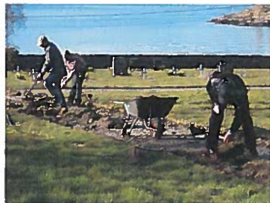
Dugnad med grusgangar