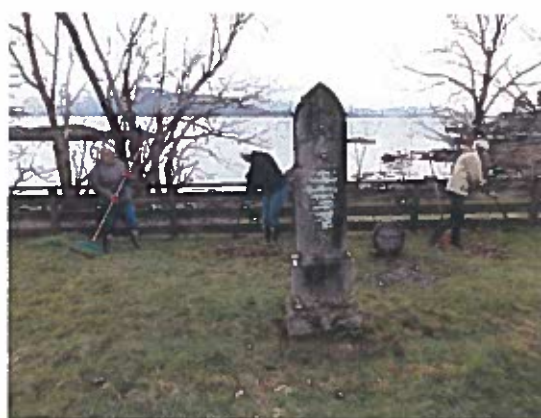
Vårstell på gravplassen