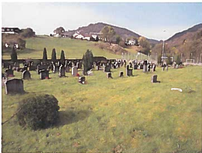
Oversiktsbilete Aakre gravplass. Gravplassen ligg midt i bygda.

Andre kommentarar: Gamal hevd frå tidlegare grunneigarar om rett på grav i «privat gravfelt».