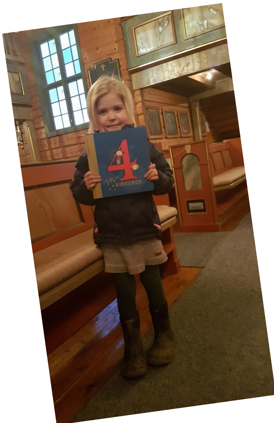
Det diakonale arbeidet